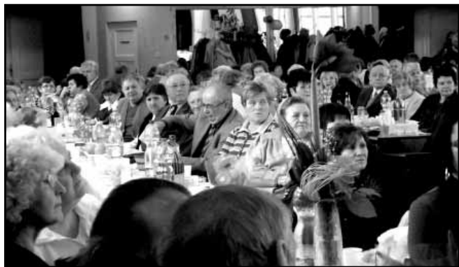
A megnyitó pillanatai