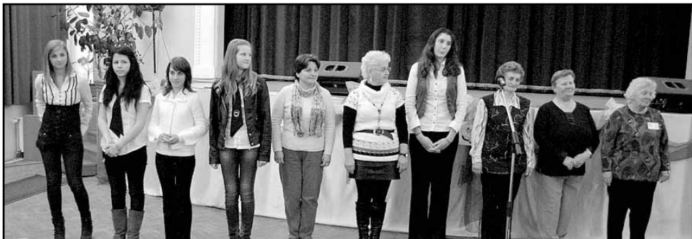
A továbbjutók egy csoportja