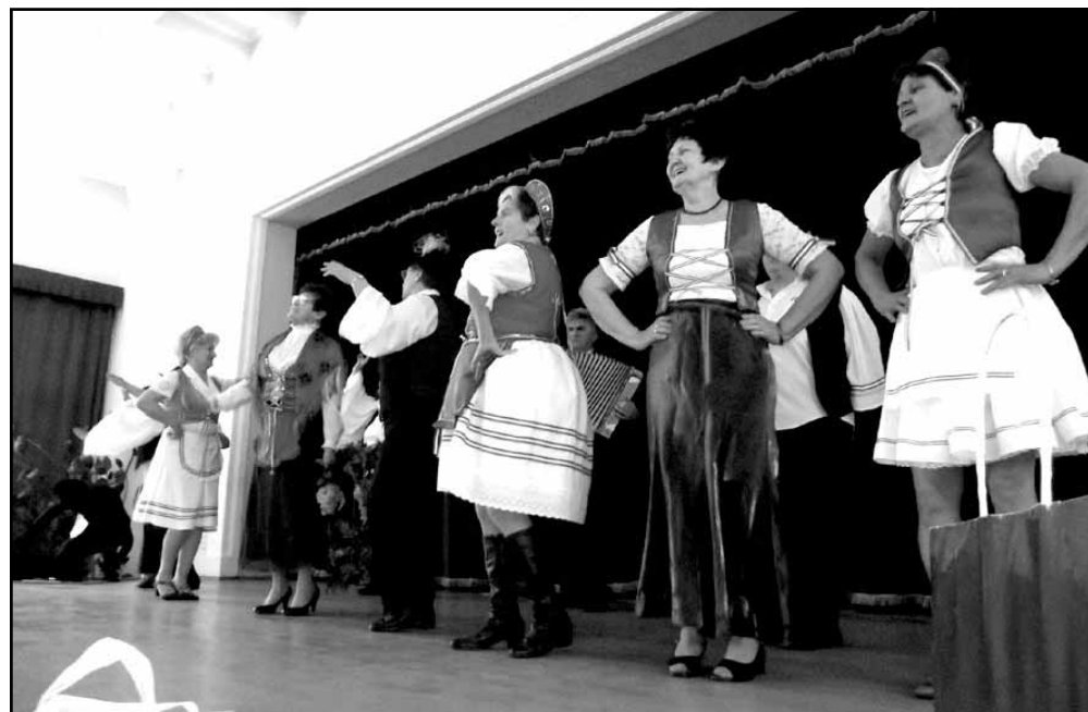
Kötegyáni nyugdíjasok a színpadon