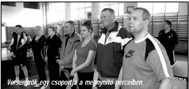
Versenyzők egy csoportja a megnyitó percekben

A megrendezett versenyszámokban a következő eredmények születtek: