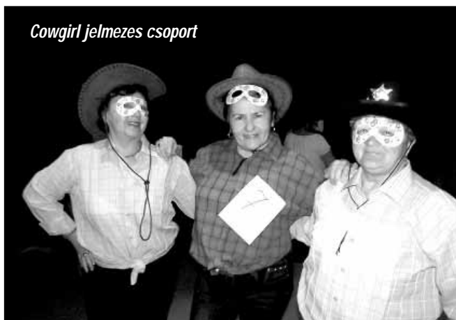
Cowgirl jelmezes csoport