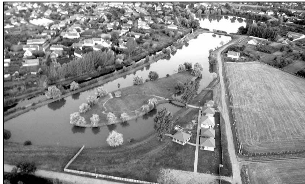
Közös kincsünk, az Éden tavak

Tekintettel arra, hogy a tavak frekvenciált területen helyezkednek el, Sarkad egyik szimbólumát jelentik, a Képviselő-testület olykor heves vitát sem nélkülöző eljárásrend mentén, megalapozott döntést hozva bizalmat szavazott a horgász, halász társadalomnak. A Képviselő-testület közel egy éves időtartamra – 2013. december 31-ig – haszonbérleti szerződés keretében, az önkormányzati tulajdonjog megtartva, az érintett három egyesület közös kérése és döntése alapján a Sarkadi BARKÁS Horgász Egyesület számára hasznosításra és kezelésre átadta az Éden tavakat, mely területet az üdülés, kirándulás és pihenés céljából az állampolgárok továbbra is szabadon látogathatnak az előírások betartása mellett.