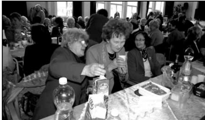
Sarkadkeresztúri vendégek asztala