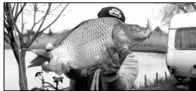
Március 18-án 1.038 kg háromnyaras pontyot hoztak a tavakba

egyesületi tagok lelkesedése töretlen marad, közös kincsünk, az Éden tavakra a város kis ékszerdobozaként tekintenek, óvják, gondozzák, fejlesztik, hozzájárulva ezzel ahhoz, hogy a horgász és halász társadalom, valamennyi itt élő sarkadi lakos, ide érkezők látogatásához elegendően horgászhaszon, halászhaszon, pihenés, kapcsolódhasson, gyönyörködhessen a szép termé-