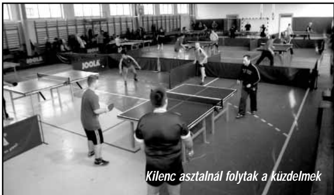
Kilenc asztalnál folytak a küzdelmek