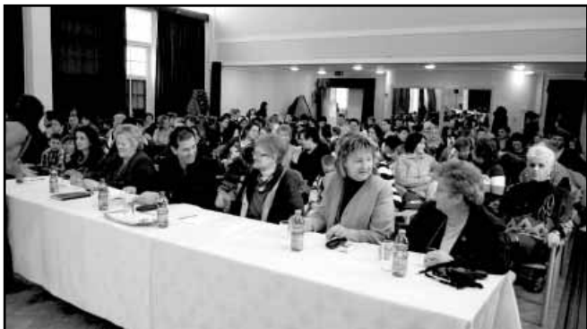
Asztalnál a zsűri