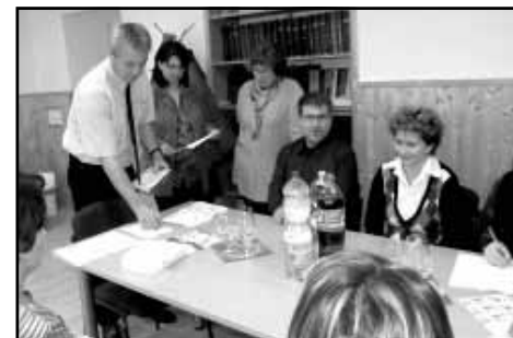
A tesztlapokat a kísérő tanárok jelenlétében szortírozzák