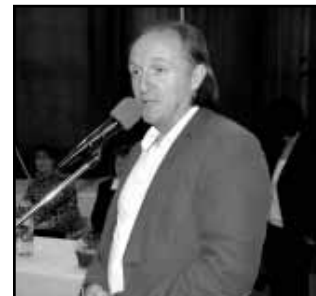
Bende Róbert polgármester köszöntötte a résztvevőket