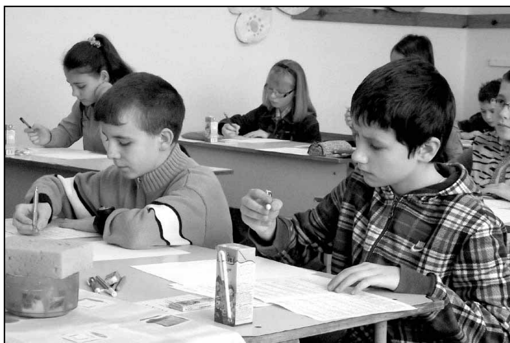
Az ötödik-hatodik osztályosok korcsoportja megkezdte a feladatok megoldását

A megyei szervezési és lebonyolítási feladatokat a sarkadi Általános Iskola látta el