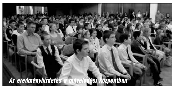
Az eredményhirdetés a művelődési központban