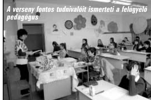
A verseny fontos tudnivalóit ismerteti a felügyelő pedagógus