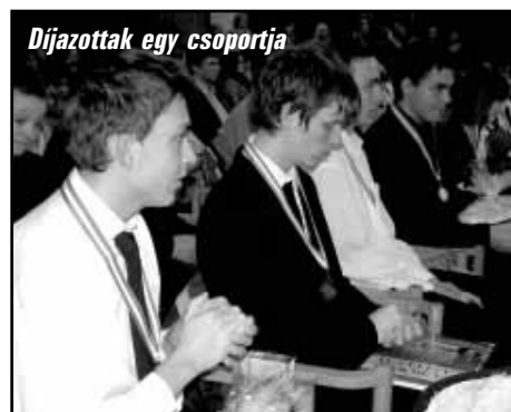
Díjazottak egy csoportja