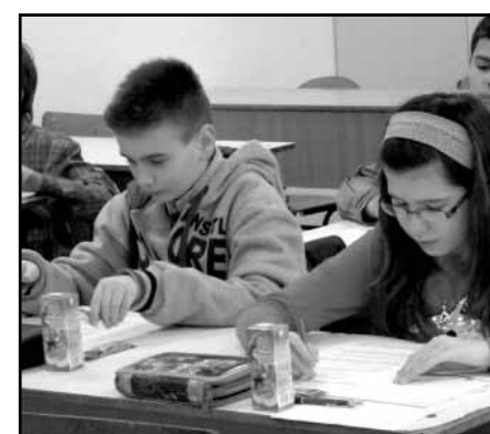
...és amint a feladatlapokkal ismerkednek