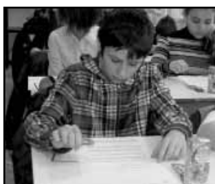
Az idő sürgető „tényező” volt...