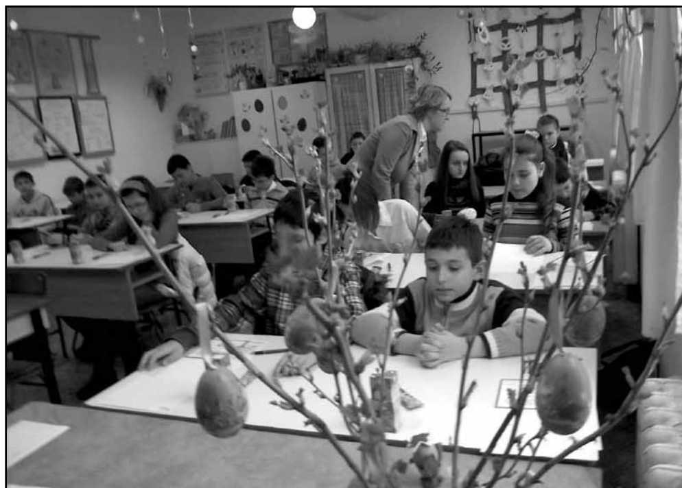
A húsvéti díszletekre pillantva a gyerekekben oldódott a verseny feszültsége