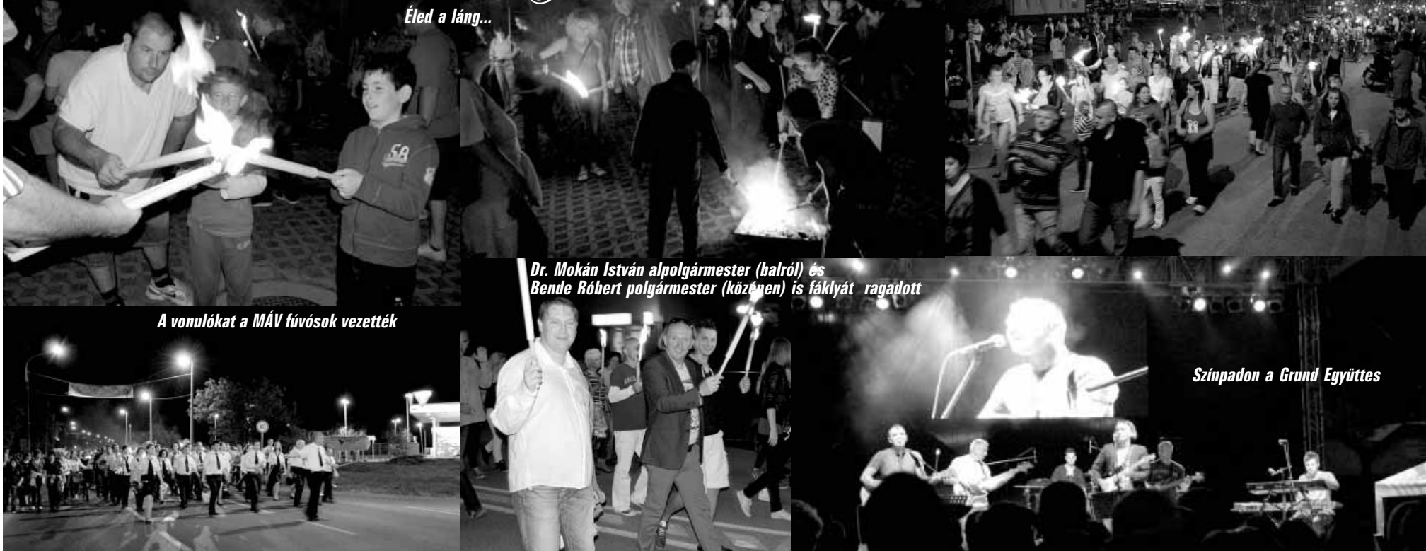
Éled a láng...

Sokan vették a fáradságot és csatlakoztak a vonulókhoz