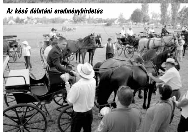
Az késő délutáni eredményhirdetés