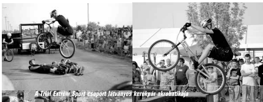
A Triál Extrém Sport csoport látványos kerékpár akrobatikája