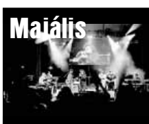
Családi májális összefoglaló