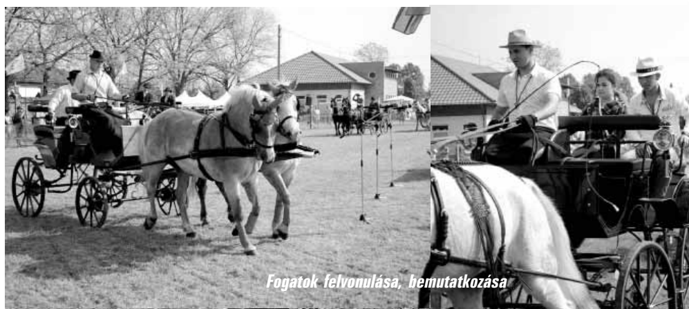
Fogatok felvonulása, bemutatkozása