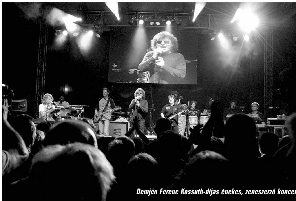
Demjén Ferenc Kossuth-díjas énekes, zeneszerző koncertjén