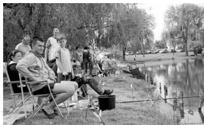
A horgászok összesen 134,84 kg halat fogtak május elsején