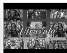
Katalikus gondolatok öt percben