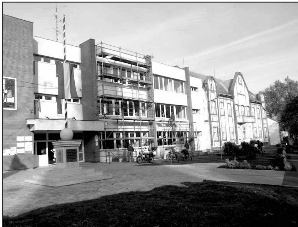
Képeink az általános iskola Kossuth utcai központi épületének homlokzati hőszigetelésekor és a nyílászárók cseréjekor készültek