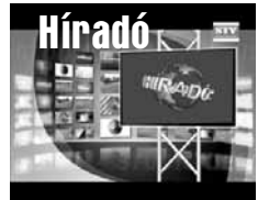
Friss közéleti hírek