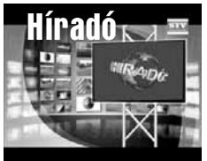
Friss közéleti hírek (ism.)