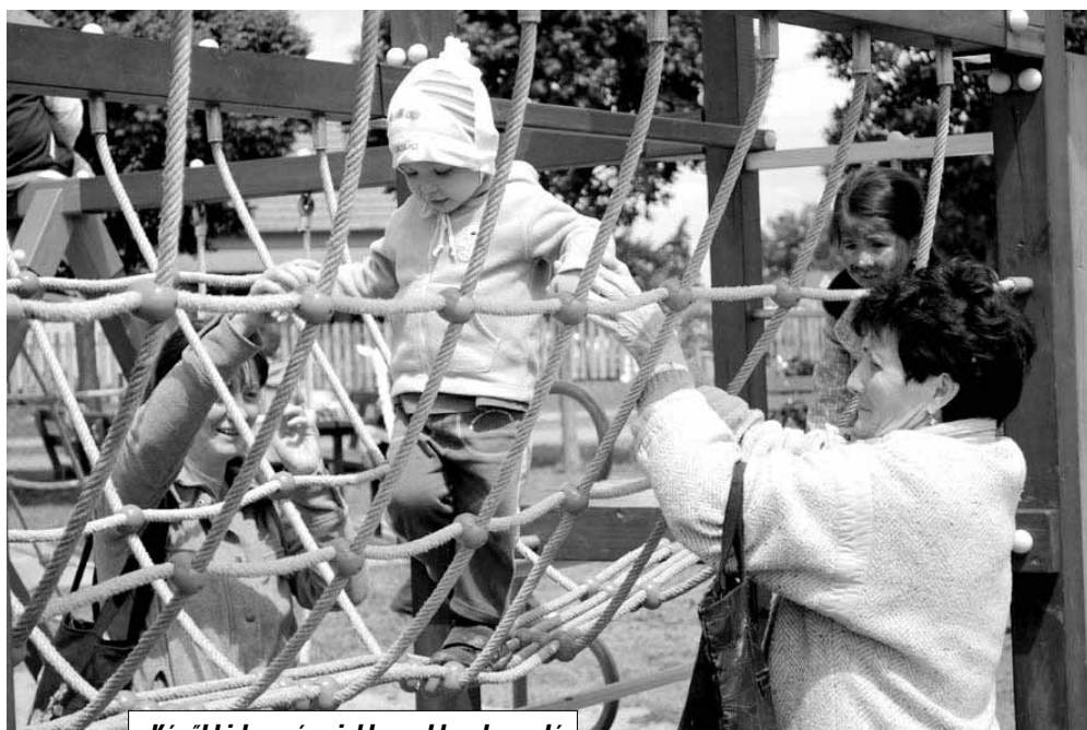
Későbbi lapszámokban ehhez hasonló képesszeállításokban mutatjuk meg a városi gyermeknap többi eseményét