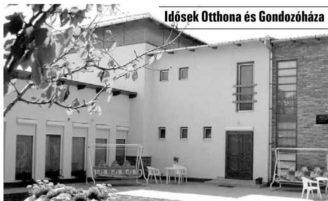
Idősek Otthona és Gondozóháza

A Gyulai u. 8. szám alatti Idősek Otthona és Gondozóháza akadálymentesített, parkosított, kellemes környezetben, családi légkörben, emelt szintű 2 ágyas, fürdőszobás szobákkal várja az idősek jelentkezését. Az otthon komplex, személyre szóló teljes körű ellátás, aktív pihenés keretében biztosítja lakói számára a kiegyensúlyozott életet. Az otthon az időskori szel-