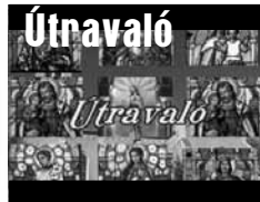
Katolikus gondolatok öt percben