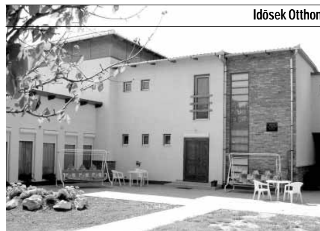
Idősek Otthona és Gondozóháza

A Gyulai u. 8. szám alatti Idősek Otthona és Gondozóháza akadálymentesített, parkosított, kellemes környezetben, családi légkörben, emelt szintű 2 ágyas, fürdőszobás szobákkal várja az idősek jelentkezését. Az otthon komplex, személyre szóló teljes körű ellátás, aktív pihenés keretében biztosítja lakói számára a kiegyensúlyozott életet.