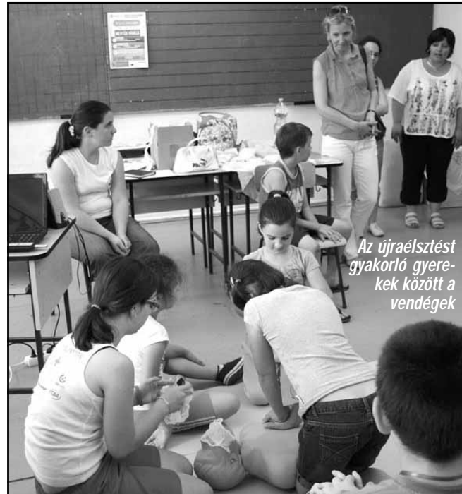
Az újraélesztést gyakorló gyerekek között a vendégek