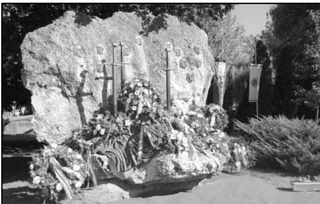
Mladonjiczky Béla (†) szobrászművész 13 aradi vértanú elnevezésű, 1988-ban felavatott alkotását azóta minden év októberében friss virágok borítják

Az Aradon, 164 esztendővel ezelőtt kivégzett honvédtisztek halála egyáltalán nem volt hiábavaló, önfeláldozá-