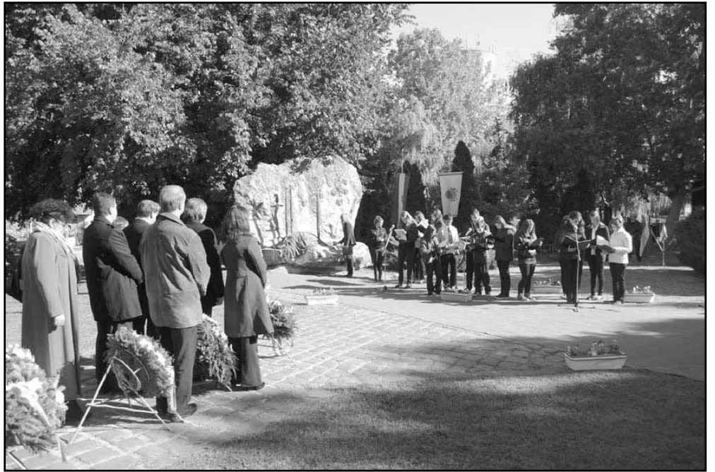
Emlékezés 164 évvel az Aradon történtek után Sarkadon, a Vértanúk terén...

Október 7-én délelőtt a Himnusz hangjaival kezdődött a Vértanúk terén az a városi rendezvény, mely az 1848 – 1849-es forradalom és szabadságharc leverésére és a mártírhalt gróf Batthyány Lajos miniszterelnökre, tizenkét honvédtábornokra, valamint egy honvédfőtisztre emlékezett. Az Általános Iskola Gyulai úti intézménye diákjainak irodalmi műsorát láthatták a jelenlévők, mely a korabeli eseményeket idézte fel. Az emlékműsort követően Csepreghy Máttyás történész megemlékező gondolatait halhatták a jelenlévők.