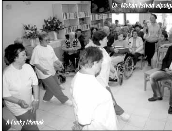
A Funky Mamák