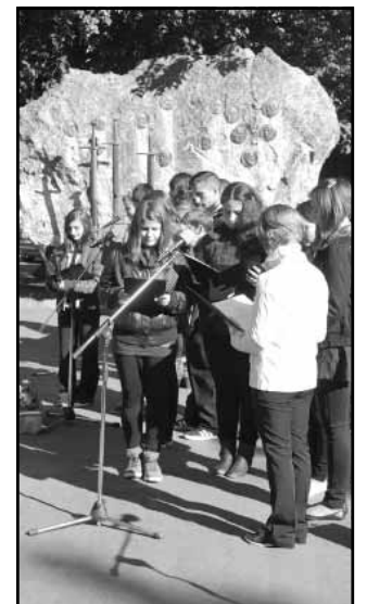
Az általános iskolások irodalmi műsora