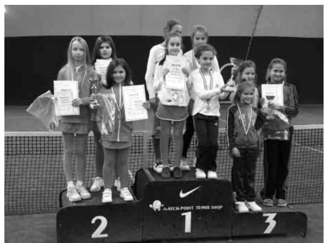
A sarkadi lányok a Magyar Tenisz Szövetség 2013. évi Országos Tennis - Play and Stay Csapatbajnokságának eredményhirdetésén

Mint arról lapunk már hírt adott, 2013. november 9-én először került megrendezésre a Magyar Tenisz Szövetség 2013. évi Országos Tennis - Play and Stay Csapatbajnoksága Budapesten, a Nemzeti Edzőközpontban.