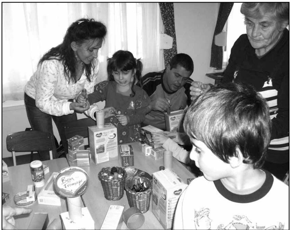
Így a délelőtti zárásaként Sarkad Város Önkormányzat még a gyermekek arcára. Az Epreskert Utcai Óvoda ajándéka varázsolt mosolyt dolgozóit

Nagy örömmel szolgált, hogy városunk vezetői is tiszteletüket tették rendezvényünkön és ajándékkal kedveskedtek az óvodásoknak.