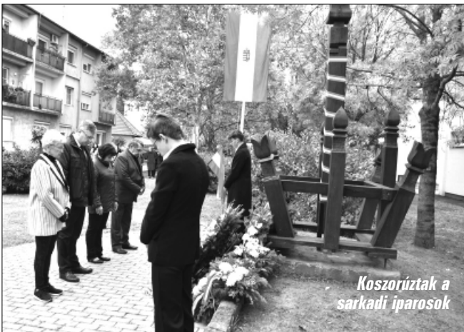
Koszorúzták a sarkadi iparosok

lássanak minket útravalóval, megtanítva, hogyan lehet élni független, egyenes gerincű nemzetként, nem pedig gyarmatként! - zárta ünnepi beszédét a sarkadi kopjafa-