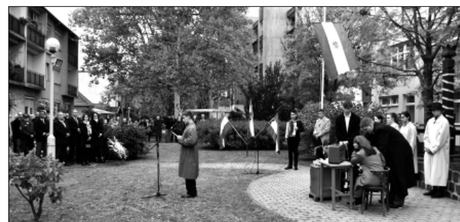
A középiskolások irodalmi műsora

Eletüket mindketten arra (folytatás a 2. oldalon)