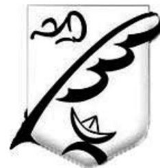
Ady Endre - Bay Zoltán Technikum és Szakképző Iskola

Az Ady Endre – Bay Zoltán Gimnázium és Kollégiumban vezetője lapunk kérdésére elmondta, ilyenkor tél elején szalagavatóra készülődnek a diákok, tanáraik, osztályfőnökeik segítségével. Ebben az évben december 16-án ünnepelték végzős diákjainkat, akiknek a szalagavató életük első, igazán méltóságteljes ünnepe. Majd négy élménydús iskolai év után számukra lassan megkezdődik a visszaszámlálás és életük új irányt vesz. Kezdődik a felkészülés az érettségi vizsgára, a továbbtanulásra, a munkára, a felelősséggel járó felnőtt életre.