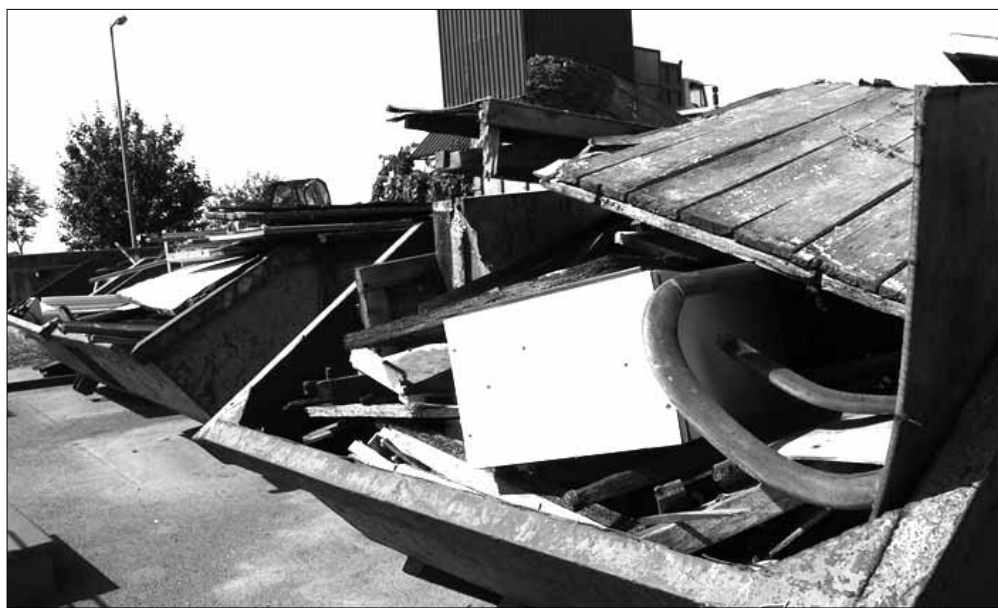
A gyulai hulladékudvaron

Noha még tél van, hamarosan megérkezik idén is a tavasz, így Sarkadon is éledezni kezdenek az udvarok, kertek. Városunkban ilyenkor sokan nekilátnak környezetük rendbetételének, elindulnak a kerti munkák, sokan ilyenkor tesznek rendet portáikon és szabadulnak meg a felgyűlt, szűk-ségtelenné váló dolgaitól. Hál' Istennek városunk lakóinak döntő többsége jogkövető, kulturált módon teszi mindezt. Nekik kívánunk segíteni az alábbi információkkal.