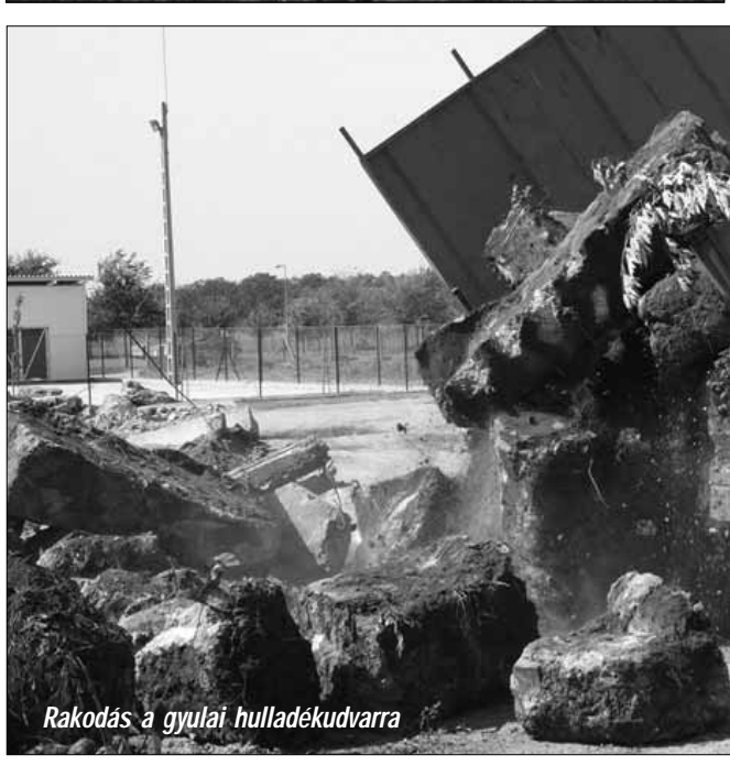
Rakodás a gyulai hulladékudvarra