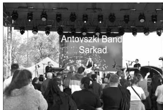
Antovszki Band Sarkad.