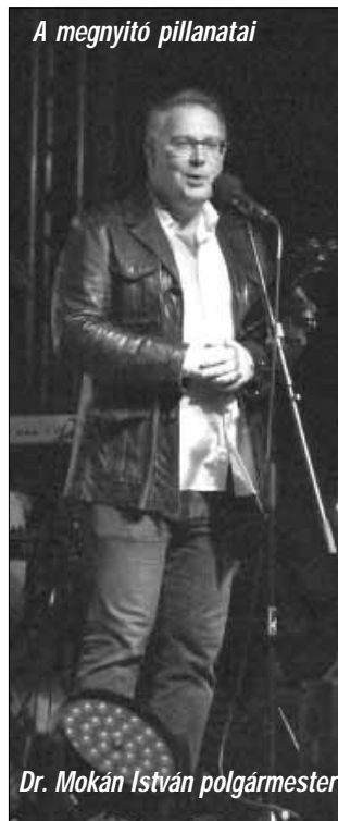
A megnyitó pillanatai