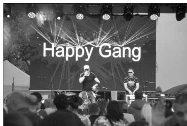
A Vásártér színiúttal telt szórakozni vágyó emberekkel