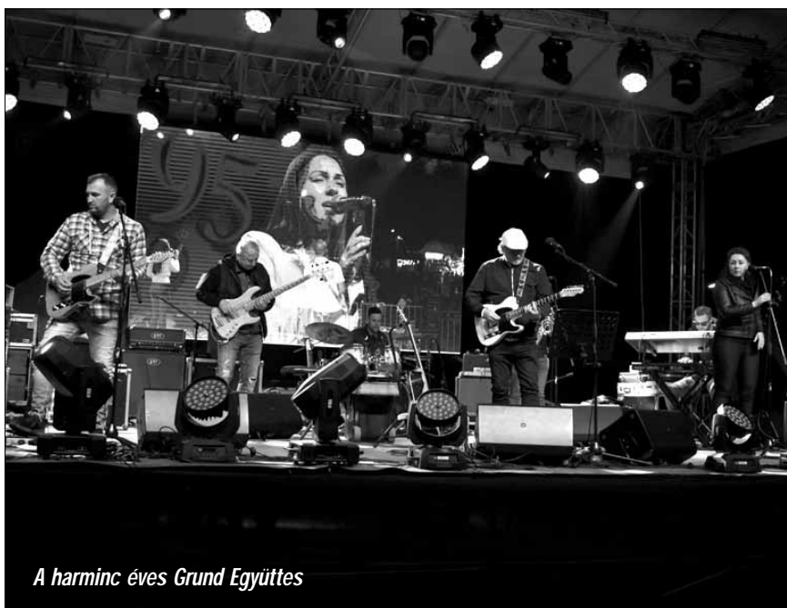
A harminc éves Grund Együttes