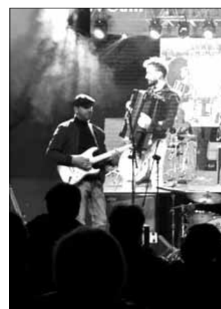
Show & Bors Zenekar