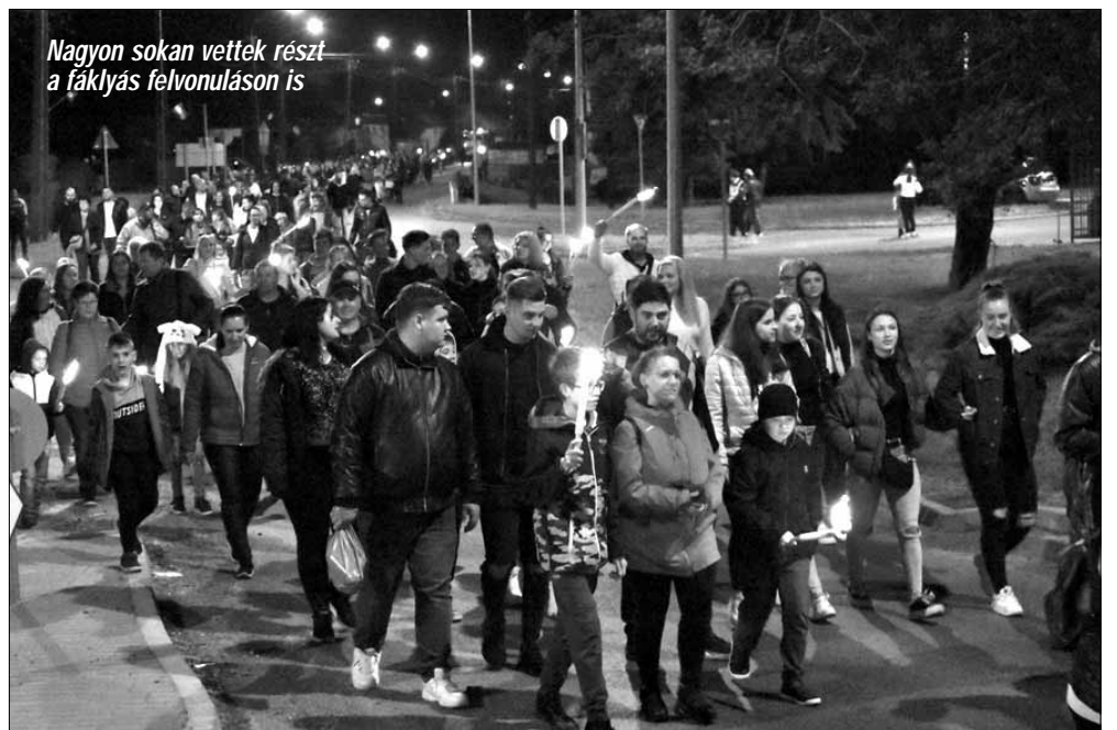
Nagyon sokan vettek részt a fáklyás felvonuláson is