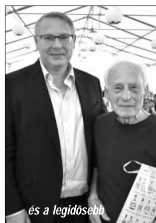
és a legidősebb