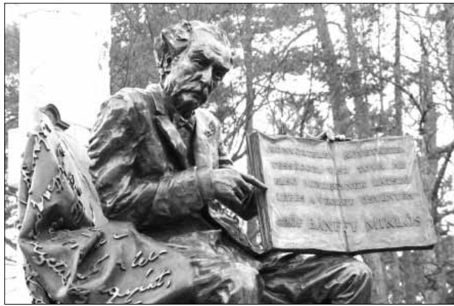
Gróf Bánffy Miklós soproni szobra

Tudjuk. A gróf, ha az angol értekezett, a brit és magyar arisztokrácia között több évszázados szoros kapcsolatokról beszélt és a közös érdekekről, a legkifogástalanabb csodálatát a franciáknak. És újra és újra - a közös érdekekről. Ha a franciával, akkor kifejezte csodálatát a francia kultúra iránt, választékos és mégis könnyed francia nyelven, hogy a gall szellem mily kitűnően tudja egyeztetni a szabadságot, eleganciát, a méltányosságot és a patriotizmust. A franciát ez meghatotta, mert Bánffy hitte is, amit annak mondott. Róma képviselőjének könnyedén megemlégette a diplomata családjának egyik középkori hőst, de az