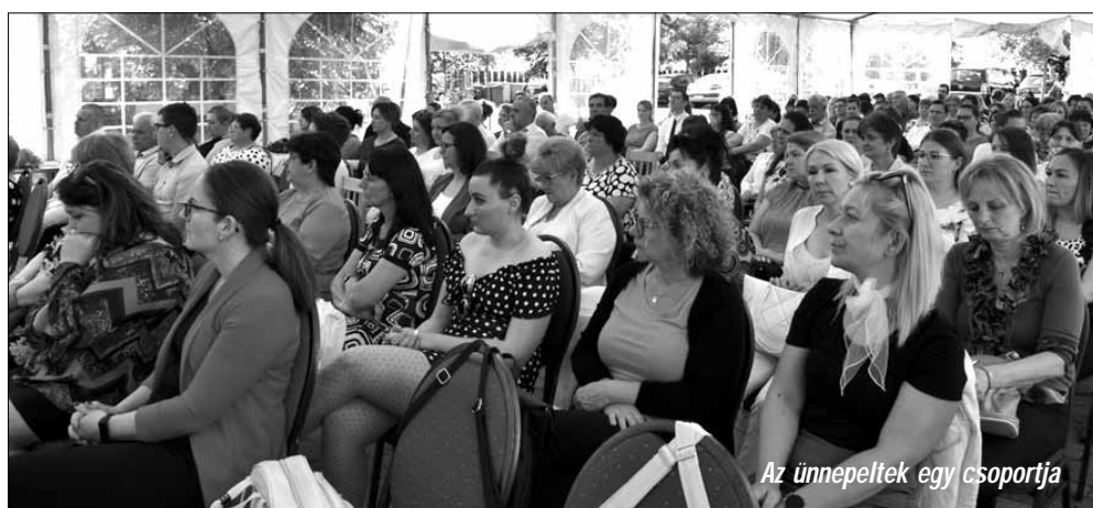
Az ünnepeltek egy csoportja