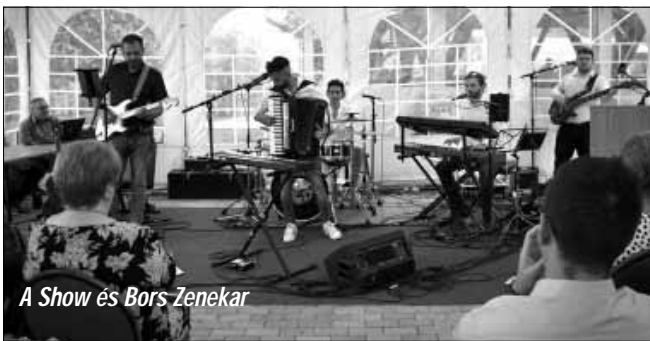
A Show és Bors Zenekar