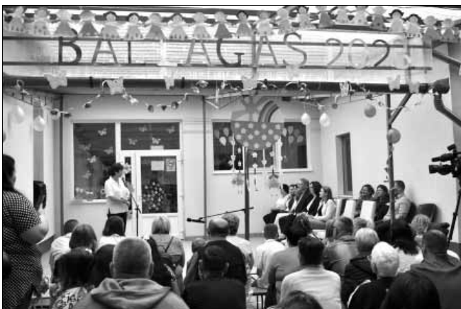
A Kossuth Utcai Tagóvoda

Az óvodák folyamatosan (folytatás a 2. oldalon)