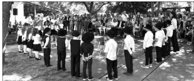
A Vasút Utcai Tagóvoda