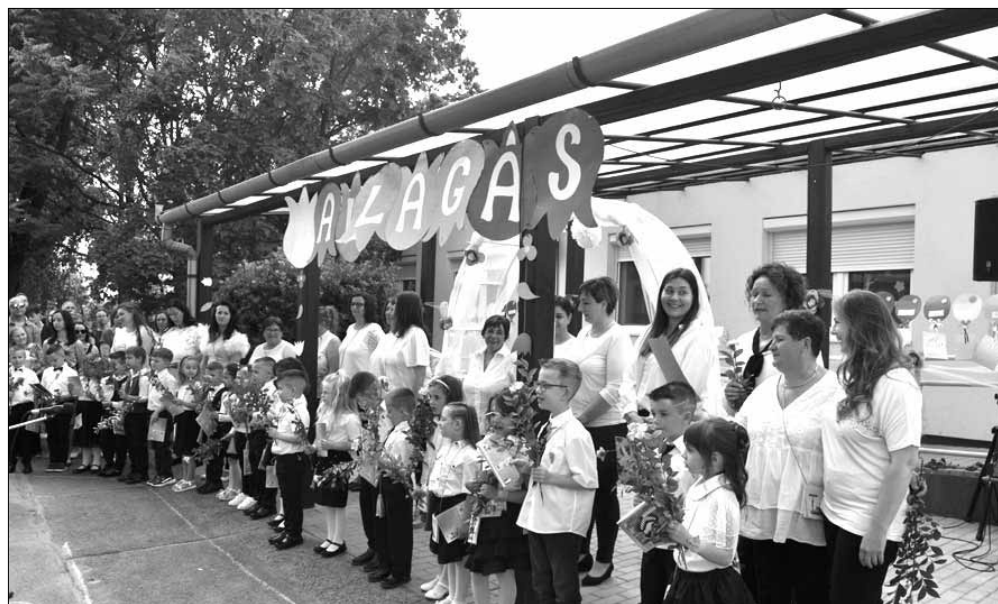
Az Egreskert Utcai Óvoda

Ezen a napon délután, az Egreskert Utcai Óvoda is virágba borult. 22 gyermek búcsúzott el óvodájától, hiszen szeptembertől már az általános iskolai tanulmányait fogják megkezdeni. Könnyes szemmel rakták fel