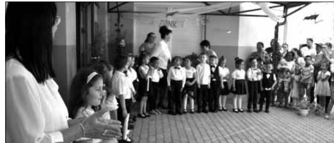
A Szalontai Úti Tagóvoda