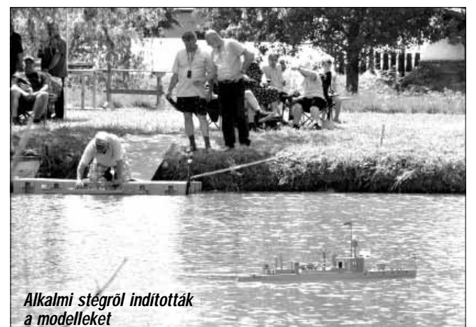
Alkalmi stégről indították a modelleket