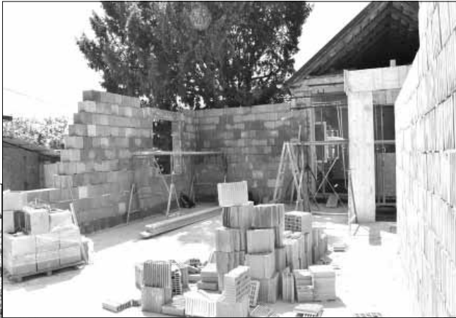
A Vasút utcai óvoda esetében egy új torna- és csoportszoba épül