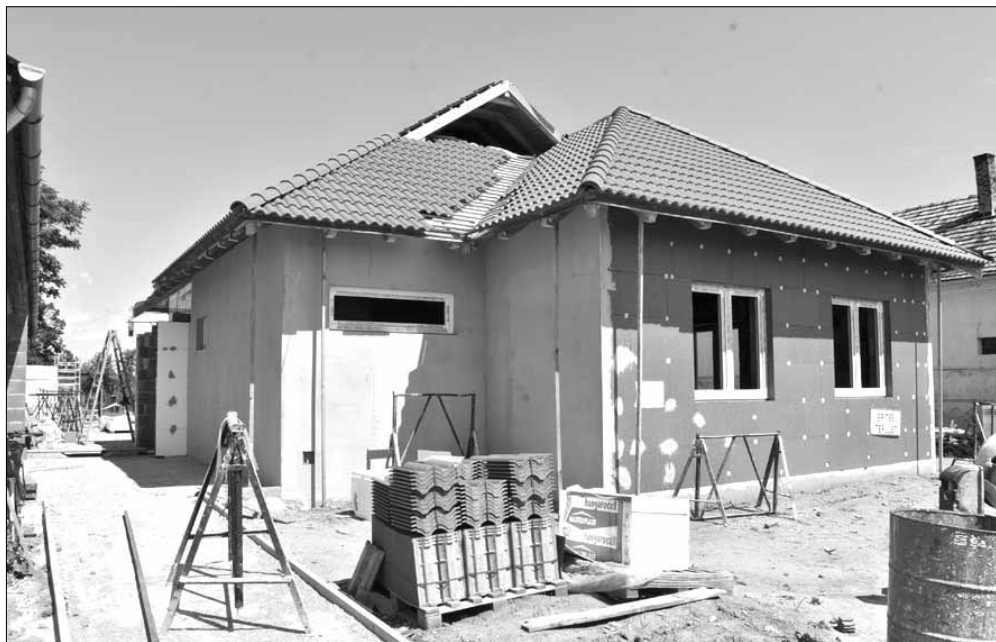
A Szalontai úti óvodába gyakorlatilag egy új épületszárny épül a meglévő mellé

Fejlesztési programjaink két zászlóshajója is lezárult a közelmúltban. Befejeződött a Kossuth utcai általános iskola fejlesztése, közel 1,4 milliárd forintból nemcsak az iskolaépület kapott felújítást és infrastrukturális korszerűsítést, hanem városunk és a térség is gazdagodott egy új, minden igényt kielégítő, XXI. századi tornacsarnokkal. Továbbá tavasszal végre birtokba vehette Sarkad és a térség fiataljai, valamint a sportolni vágyó nagyközönség a Nemzeti Köznevelési Infrastruktúra Fejlesztési Program keretében, 1 milli-