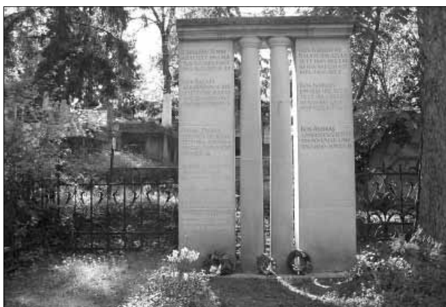
Kós Károly sírja a kolozsvári Házsongárdi temetőben