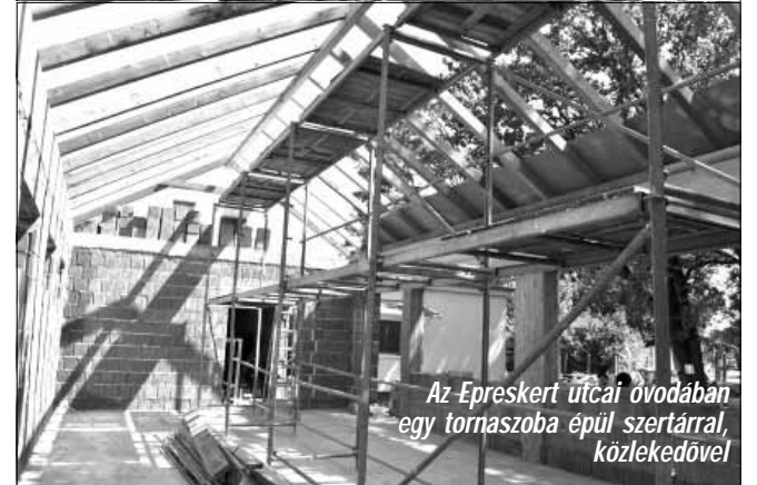
Az Epreskert utcai óvodában egy tornaszoba épül szertárral, közlekedővel