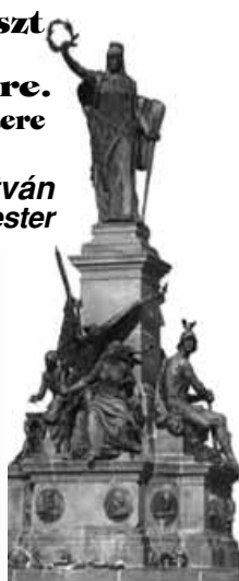
(Az aradi Szabadság szobor)