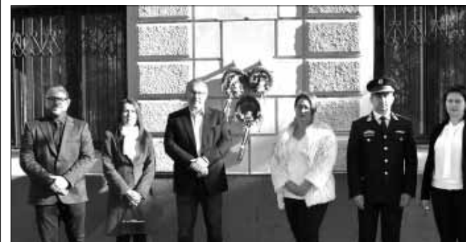
A rendőrkapitányság épületének falánál

A városi ünnepségnek helyet adó emlékműnél előbb a Gyulai Szakképzési Centrum Ady Endre - Bay Zoltán Technikum, Szakképző Iskola, Gimnázium és Kollégium diákjainak színvonalas, forradalmi időket felidéző műsorát tekinthették meg az ünnepségre kilátogató sarkadiak. A középiskola diákjai a kopjafa előtt berendezett enteriőrben 2023-ból röpitették az ünneplőket az 1950-es évek Rákosi diktatúrájába, majd 1956-ba. A közönség így visszarepülve az időben, szinte a pesti utcákon érezte magát, a diákokkal közösen élhette át a bátort kiállást, majd az emberi sorsokat, életpályákat derékbá törő, sokak halálát eredményező véres megtorlást.