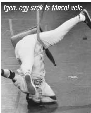
Igen, egy szék is táncol velem

– Általában heti kétszer, alkalmanként 4-5 órát edzek. Muszáj szinten tartanom magam. Például volt, hogy el kellett gondolkodnom egy előreszálló előtt, pedig korábban lazán megcsináltam. Fellépések, versenyek előtt heti három napot gyakorolok. Ilyenkor felveszem magam videóra, és az alapján javítok azon, amin szükséges. A legközelebbi nagy rendezvény a Cypher Town lesz Budapesten, kvázi világbajnoki selejtező, amelyre 70