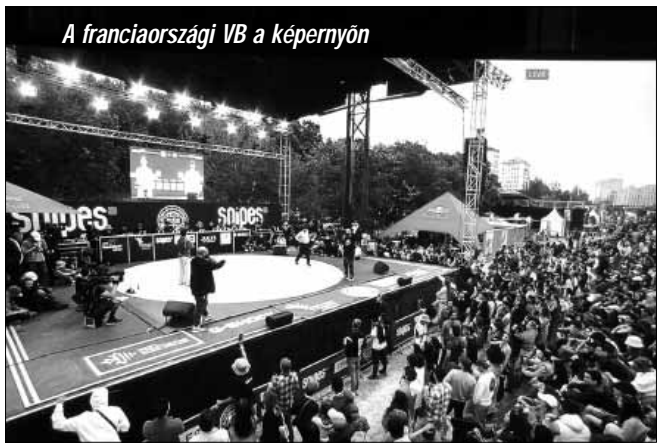
A franciaországi VB a képernyőn