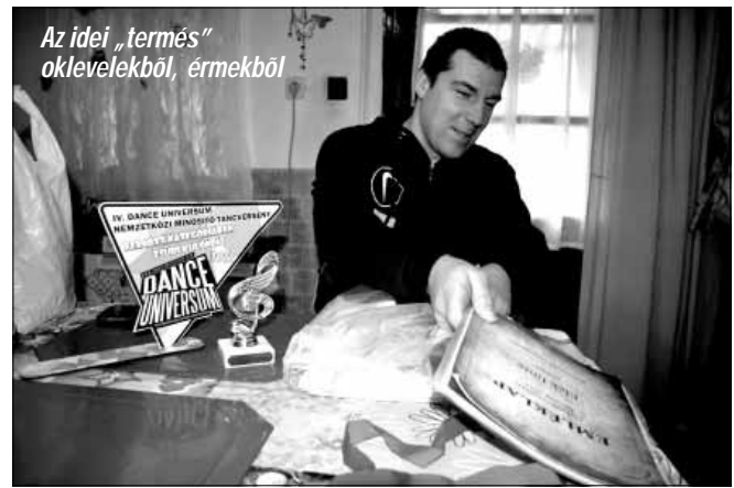
Az idej „termés” oklevelekből, érmekből