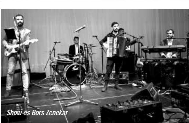
Show és Bors Zenekar