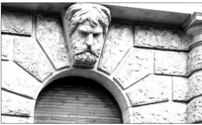
A képen egy figurális zárókó látható

...997-ben vagyunk, kegyetlen csata után. Koppány életével fizette meg a Vajk-