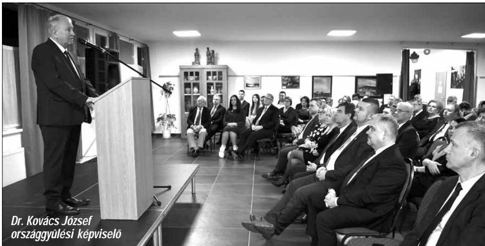
Dr. Kovács József országgyűlési képviselő

(folytatás az 1. oldalról) főt számláló családja büszke lehet a városfejlesztő programjainkra és arra, hogy a városvezetés minden sarkadi korosztályra odafigyel, legfőképpen a kiskorúakról, a kisgyermekektől kezdve az arany szívű nyugdíjasainkig. Továbbá méltán lehetünk büszké azokra a szép eredményekre, amelyeket városunk fiataljai és felnőttek polgárai értek el különböző versenyeken, megmérettetésükön a mögöttünk hagyott, egyáltalán nem könnyű idő-