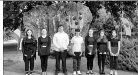
Az iskola diákjai színvonalas irodalmi műsort adtak az október 6-ai városi megemlékezésen

szervezte azzal a céllal, hogy a diákok a tanórák mellett további tartalmas és szórakoztató délutáni időtöltésre találjanak az iskola falain belül is, valamint felkészüljenek a tavaszra tervezett ügyességi versenyre.