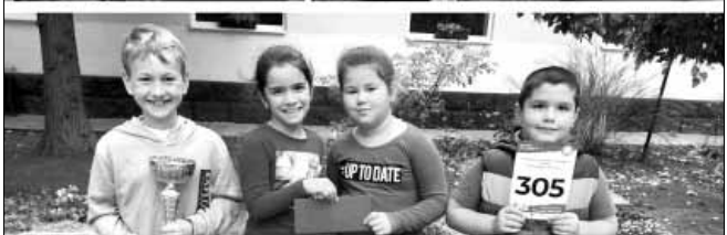
Október 19-én a Gyulai úti iskola kis csapata is részt vett a 26. Csabai Kolbászfesztiválon, a „Sarkadi Falatkák” különdíjasok lettek