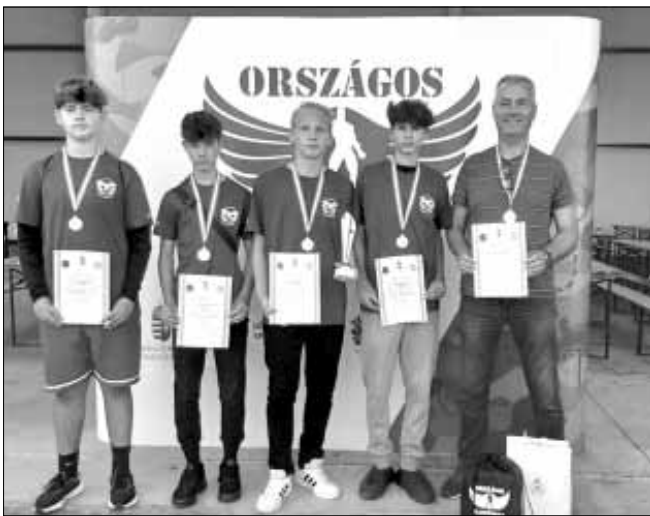
A XXII. Országos Haditorna Verseny Békés vármegyei döntőjében az általános iskolák versenyében a Sarkadi Általános Iskola Gyulai úti csapata szerezte meg az 1. helyezést és a különdíjat