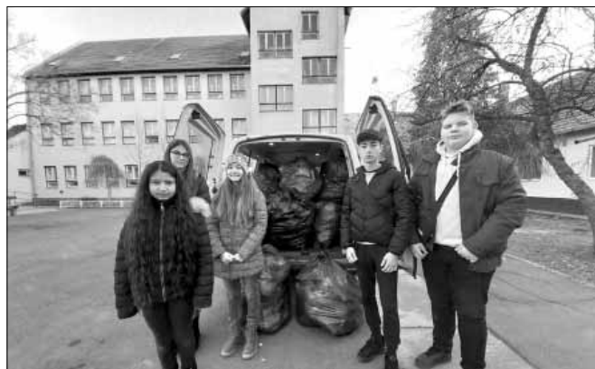
A városvezetés segítségével beteg gyerekeknek juttattak el tíz nagy zsák plüssjátékot