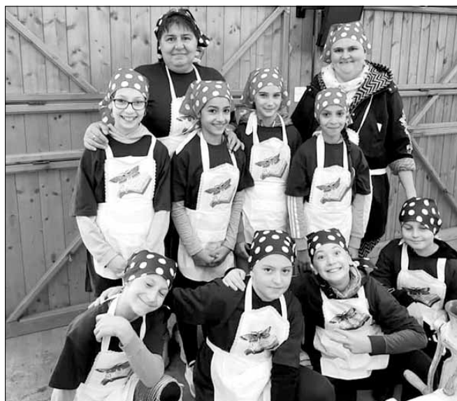
A 4. osztály tanulói közül álló két csapat különdíjban részesült a 26. Békéscsabai Kolbászfesztiválon