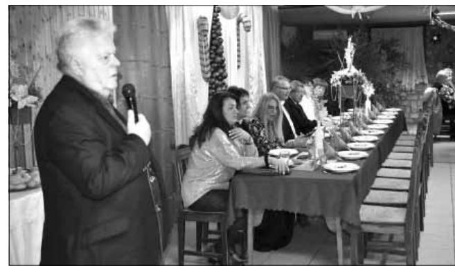
Kreszta Traján, az Országgyűlés román nemzetiségi szószólója