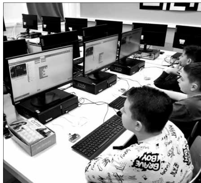
Iskolánkban a gyerekek járhatnak robotika szakkörre

December 20-án „Aktív iskola családi napot”, sportfesztivált tartottunk. Ezen a napon mutatkozott be iskolánk meg-