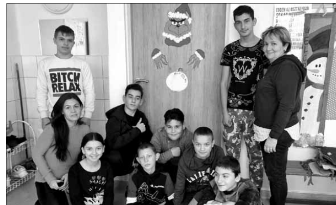
Az eltérő tantervű tagozat tehetséges tanulói