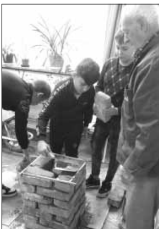
Pályorientációs nap a Sarkadi Ipartestület tagjaival