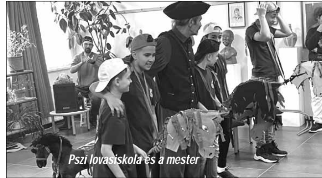
Pszí lovasiskola és a mester