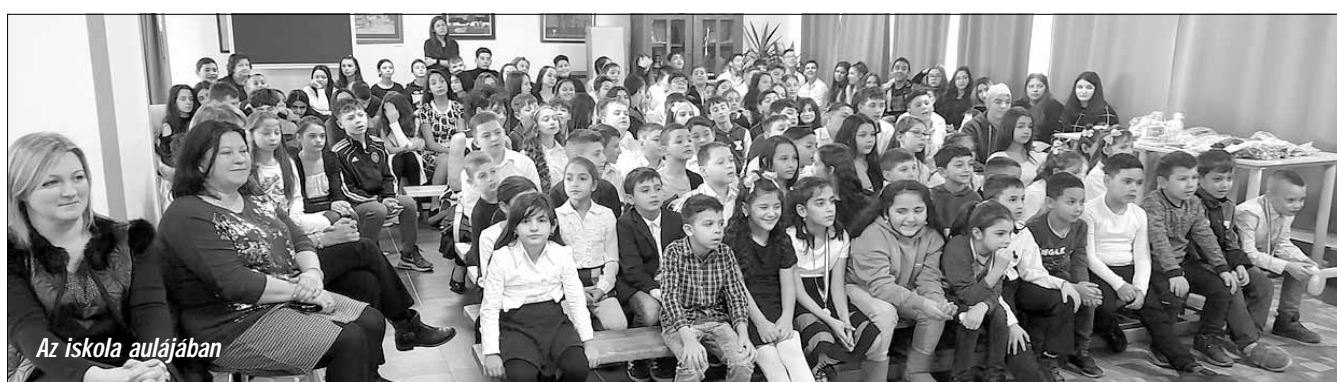
Az iskola aulájában

Beszámoló a 2023/2024-es tanév első félévében zajló munkánkról, elért eredményeinkről