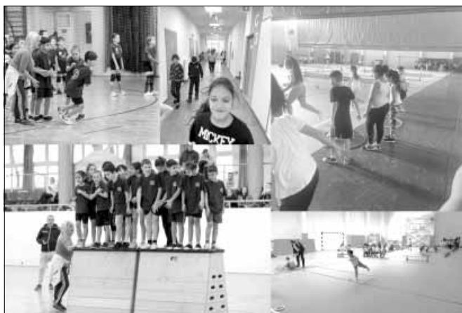
Sport, sport, sport... az új sportcsarnokban