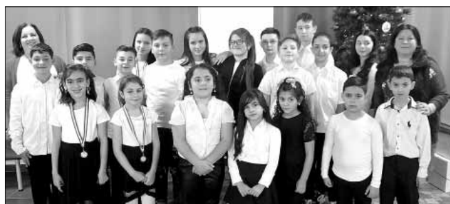
„A karácsonyi rajzversenynek” ismét nagy sikere volt