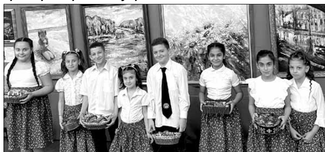
Az Iskolagaléria megnyitójának a gyerekek is résztvevői