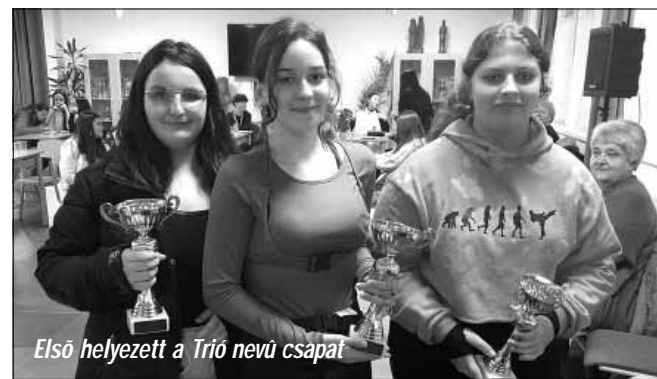
Első helyezett a Trió nevű csapat