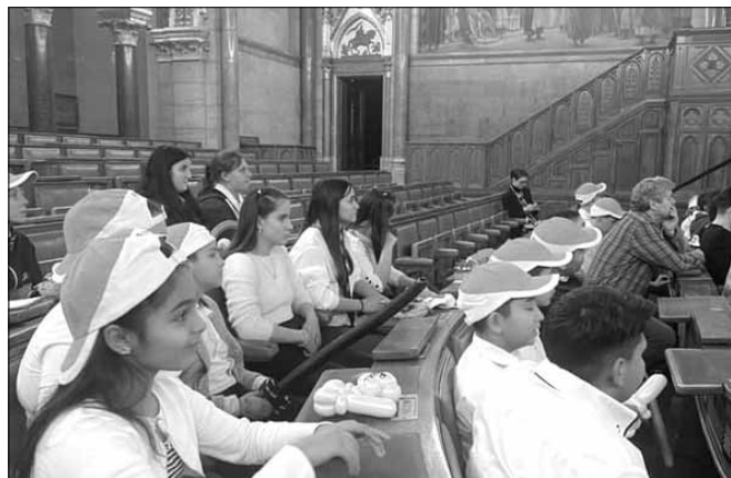
Gyerekkarácsony a Parlamentben