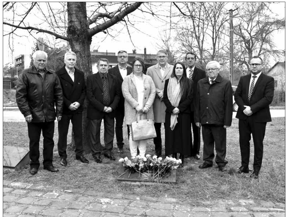
A képviselő-testület tagjai és városunk vezetői az Aradi Vértanúk terén található emléktáblánál is lerótták kegyeletüket

Faludy, aki annak ellenére, hogy a II. világháborút követően Amerikából hazatérve, a „Népszava” munkatársaként maga is számos írásával támogatta a Rákosi-rendszer ideológiai alapon megjelölt ellenségeit, 1950 nyarára a rendszer ellenségévé vált. Őt is letartóztatták, elhurcolták a méltán hírhedt Andrassy út 60-ba, ott erő-