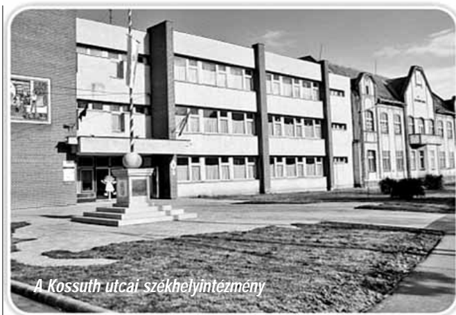
A Kossuth utcai székhelyintézmény

hetik magukat gyermekeink. Terveink szerint a következő évtől már ökoiskolaként szervezzük a nevelő-oktató munkánkat.