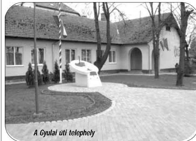
A Gyulai úti telephely