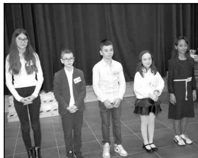
A III. korcsoport továbbjutói