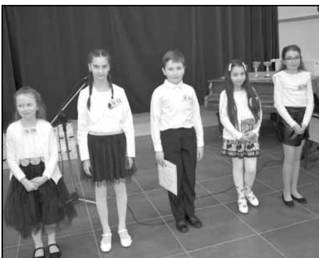
A II. korcsoport továbbjutói