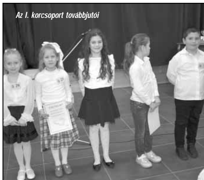
Az I. korcsoport továbbjutói