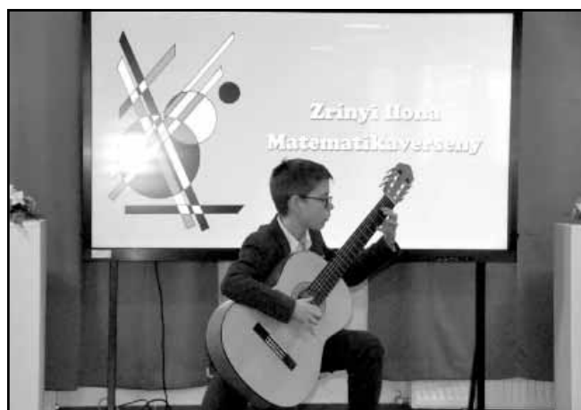
Az ünnepség sarkadi diákok műsorával kezdődött