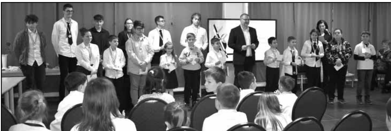
Az országos versenyre szóló meghívóleveleket városunk polgármestere, dr. Mokán István adta át