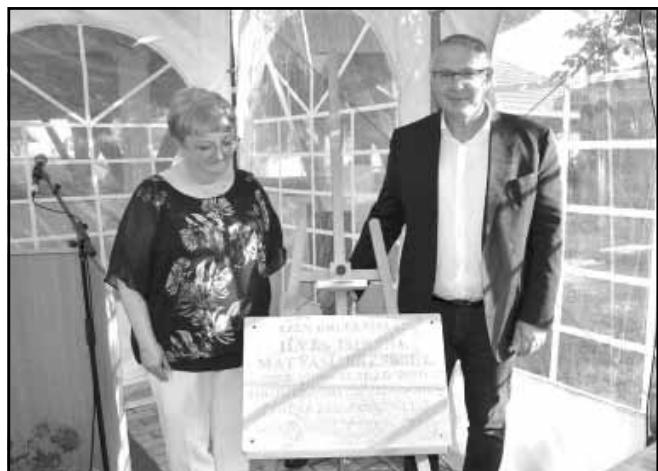
Ilyés Imréné Mátyási Erzsébet emléktáblájának leleplezése