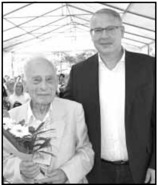
A legidősebb és a legfiatalabb munkatárs köszöntése