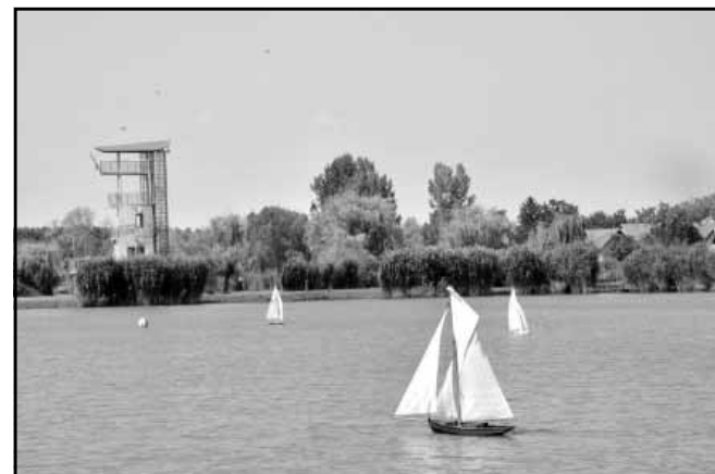
Vitorlás modellek futamai (a kijelölt pályán a leggyorsabb győz)