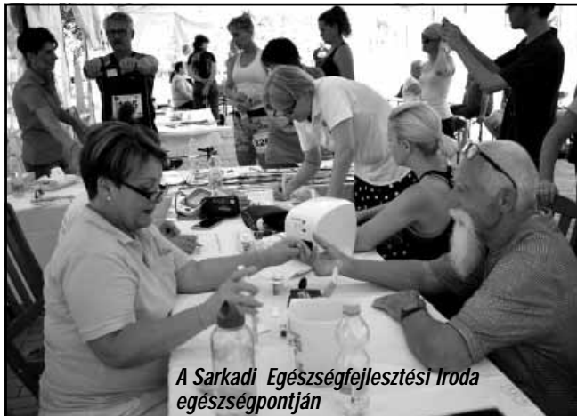
A Sarkadi Egészségfejlesztési Iroda egészségpontján