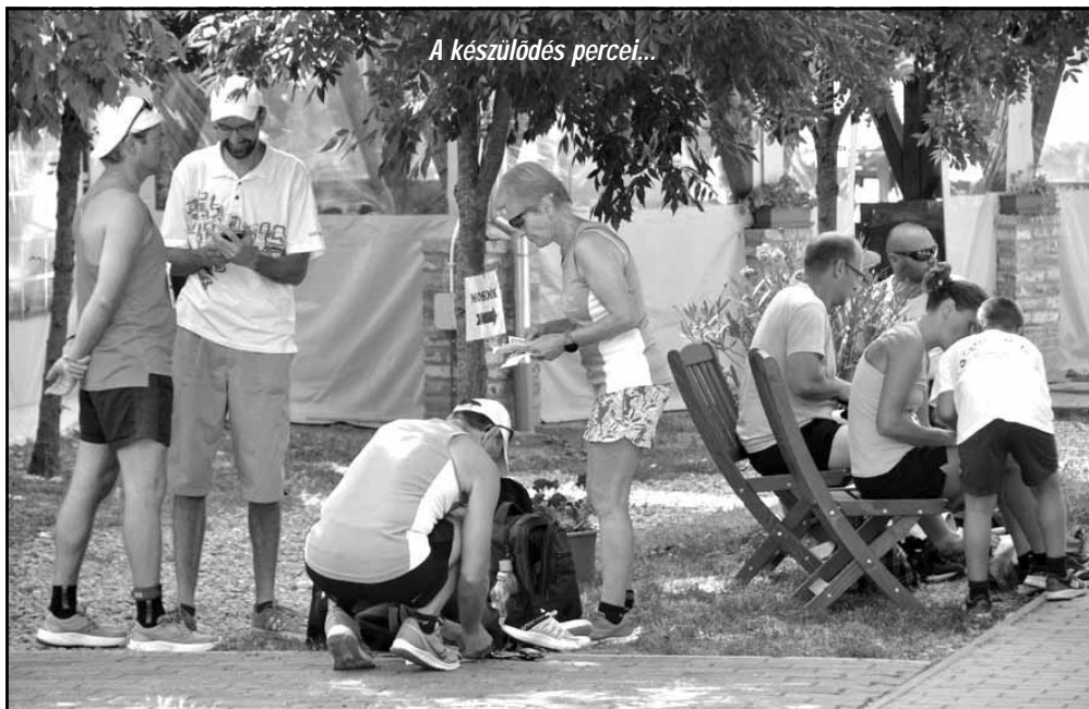
A készülődés percei...

koordinált népes segítőcsapattal szervezték meg és bonyolították le. Mivel az ismert sarkadi futópáros már több kisebb, de igen jól sikerült futóeseményt szervezett városunkban, nem volt kérdéses, hogy a város vezetői is teljes mellszélességgel támogatják a sportrendezvényt. Így az önkormányzat is felsorakozott a futók mögé, amikor ennek a nagyszabású versenynek az ötletével megkezdte dr. Mokán István polgármestert.