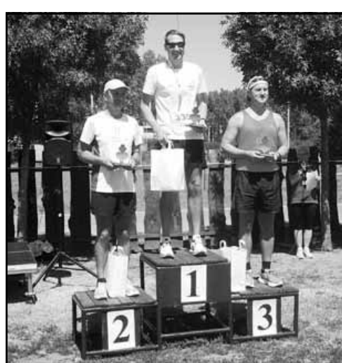
A férfi 6 km-es táv helyezettei