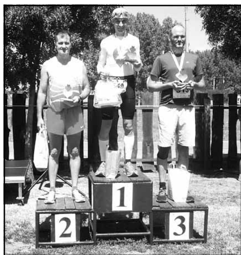
A férfi 10 km-es táv helyezettei