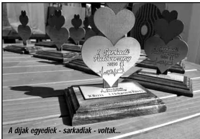
A díjak egyedi sarkadiak voltak...