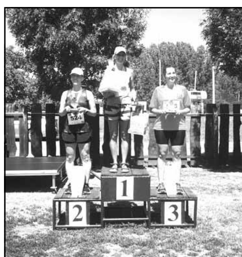
A női 10 km-es táv helyezettei