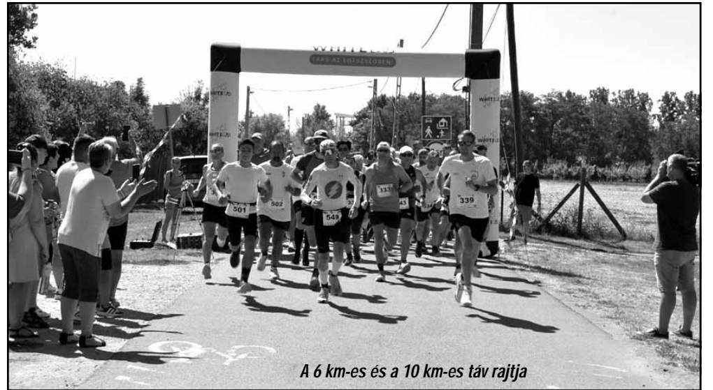
A 6 km-es és a 10 km-es táv rajtja