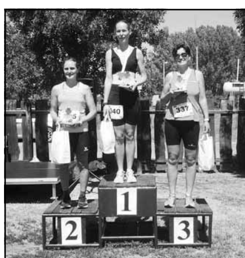
A női 6 km-es táv helyezettei