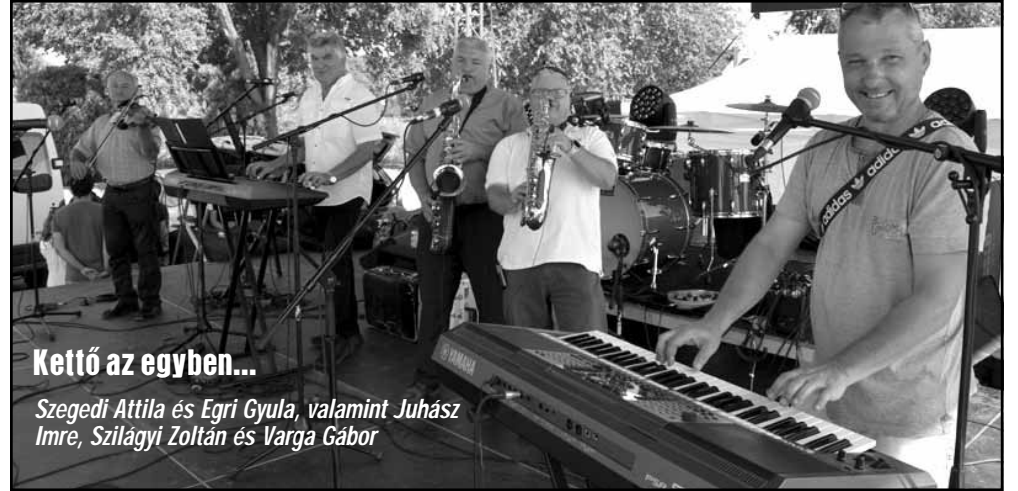
Kettő az egyben...