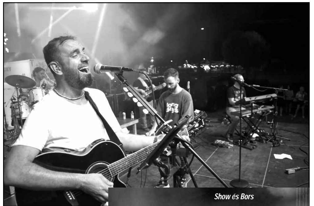
Show és Bors

Augusztus 19-én és augusztus 20-án újra a kikapcsolódni, szórakozni vágyóktól volt hangos a Vásártér és az Éden-tavak környéke. A két nap folyamán több ezer ember látogatott ki a különböző zenés rendezvényekre és szórakozhatott önfeledten, ki-ki megtalálva a számára legkedveltebb előadókat. Visszatekintve pedig bátran kijelenthetjük, hogy Békés vármegye egyik legnagyobb, legszínvonalasabb és nem utolsó sorban ingyenesen látogatható szórakoztató programozatát szervezte meg Sarkad Város Önkormányzata.