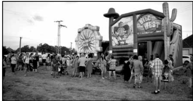
A Vásártér szomszédságában két napig vidámpark is működött