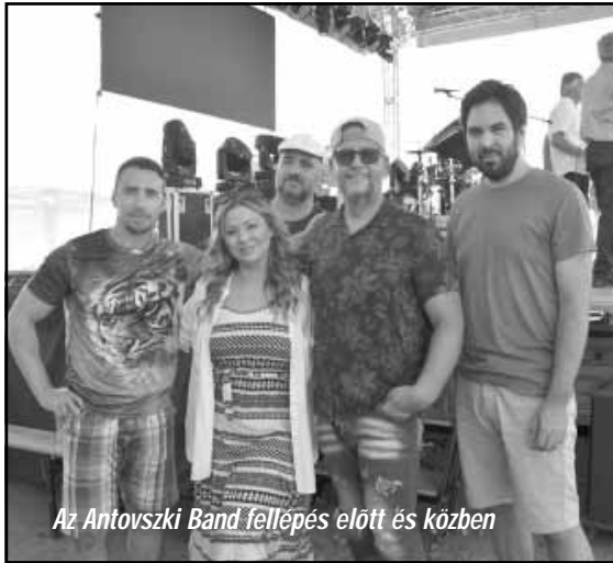
Az Antovszki Band fellépés előtt és közben