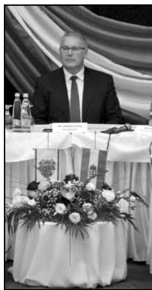
Dr. Mokán István polgármester

A program bemutatása során a polgármester kihangsúlyozta, hogy szolgálata során az arany középúton kíván járni, így nagyon fontosnak tartja azt, hogy az önkormányzatnál szakmai munka folyjon, amit határozott irányítás és nyugodt erő kíséren. A munkásságát a továbbiakban is emberséggel, az embertársak iránti tisztelettel, közvetlenséggel, szeretettel és segítőkészséggel kívánja folytatni, olyan városvezetőként, akit bármikor elérnek a város lakói, s akihez mindig bizalommal fordulhatnak kérdéseikkel, kéréseikkel, javaslataikkal.