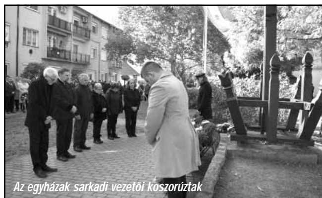
Az egyházak sarkadi vezetői koszorúzták