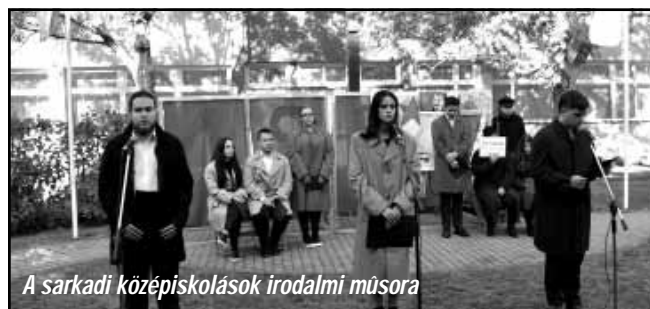
A sarkadi középiskolások irodalmi műsora