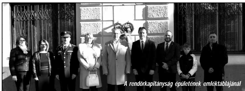
A rendőrkapitányság épületének emléktáblájánál

gyar társadalom 1956. október 23-án, az azt követő 12 napon, majd a szovjet haderő bevonulását követő, hosszú hónapokban ország-szerte, Budapesten, Békés megyében, vagy akár Sarkadon.