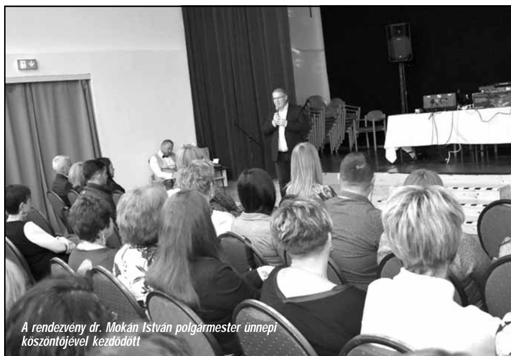
A rendezvény dr. Mokán István polgármester ünnepi köszöntőjével kezdődött

Sarkad Város Önkormányzata ebben az esztendőben is a Sarkadi Általános Iskola Kossuth utcai székhelyintézményének kamaratermében köszöntötte november 8-án a Mazsola Bölcsőde és a Kistérségi Humán Szolgáltató Központ dolgozóit, illetve a két intézmény már nyugdíjba vonult munkatársait a Szociális Munka Napja alkalmából.