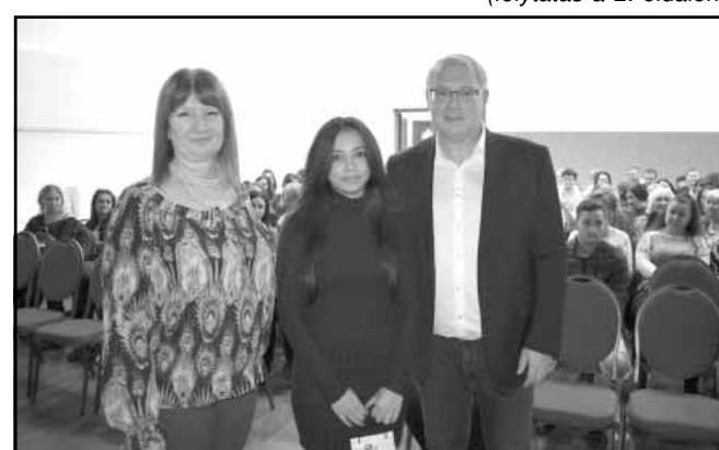
...és a legfiatalabb dolgozó