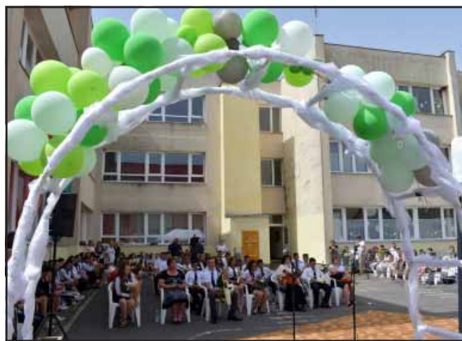
Általános iskolai ballagások

A ballagások és az évzárók alkalmából rendszeresen jutalmaznak az intézmények és az önkormányzat is a kiemelkedő tanulóit, tanulmányi teljesítményeket. Büszkék vagyunk valamennyiükre!