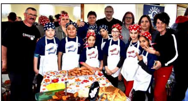
Negyedik sarkadi kolbászverseny és pálinkamustra