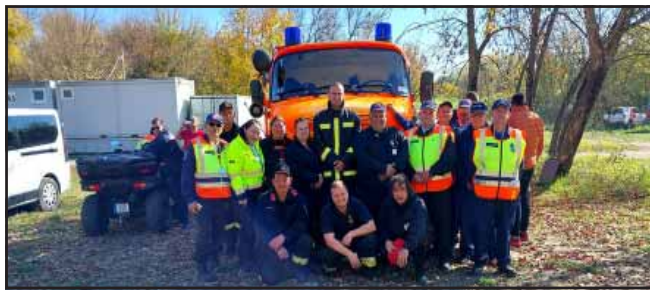
Újabb sikeres vizsgát tettek az önkéntes tűzoltók