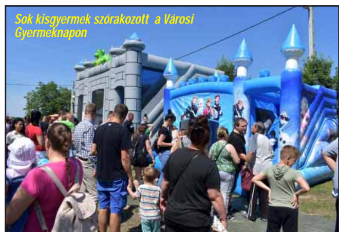
Sok kisgyermek szórakozott a Városi Gyermeknapon