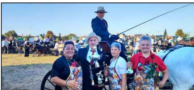
A sarkadi fogathajtók a szomszédos romániai versenyeken is helytálltak