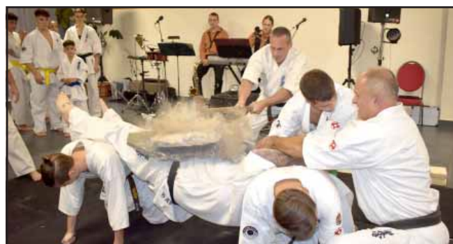
A Nintai Kyokushin Karate SE második alkalommal rendezte meg az önkormányzattal közösen a Sarkadi Jótékonyági Sportbált