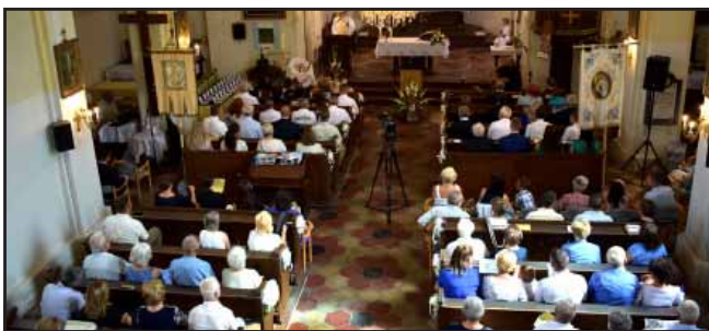
Augusztus 20-ai városi ünnepség a katolikus templomban