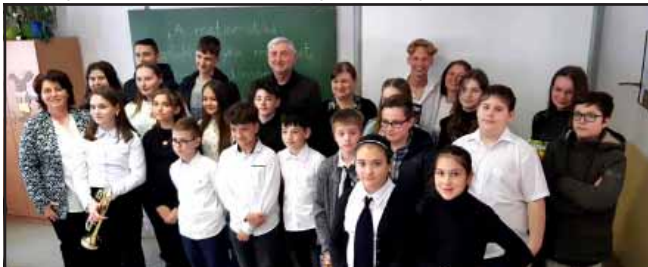
Hagyományörző matematikaverseny a Gyulai úti iskolában