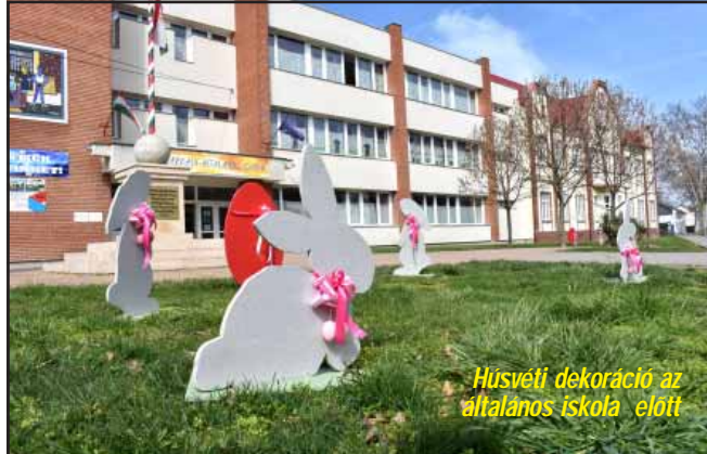
Húsvéti dekoráció az általános iskola előtt

védelme is. Ezekben a városüzemeltetéshez kapcsolódó munkákban nagy segítséget jelent a közmunkaprogram.