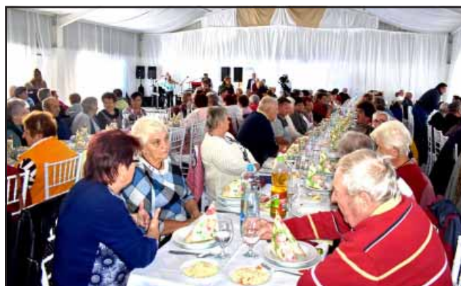
Az Idősek Világnapja alkalmából köszöntöttük a sarkadi nyugdíjas, mozgáskorlátozott és cukorbeteg egyesületek tagjait