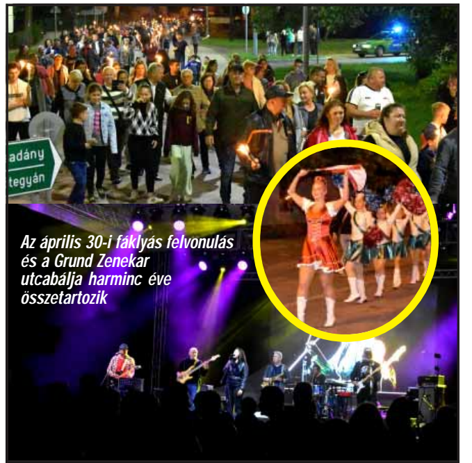
Az április 30-i faklyás felvonulás és a Grund Zenekar utcabálja harminc éve összetartozik