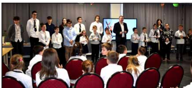
A Zrínyi Ilona Matematikaverseny eredményhirdetése