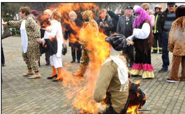
Téltemető – tavaszköszöntő az AFÉSZ Nyugdíjas Egyesület szervezésében