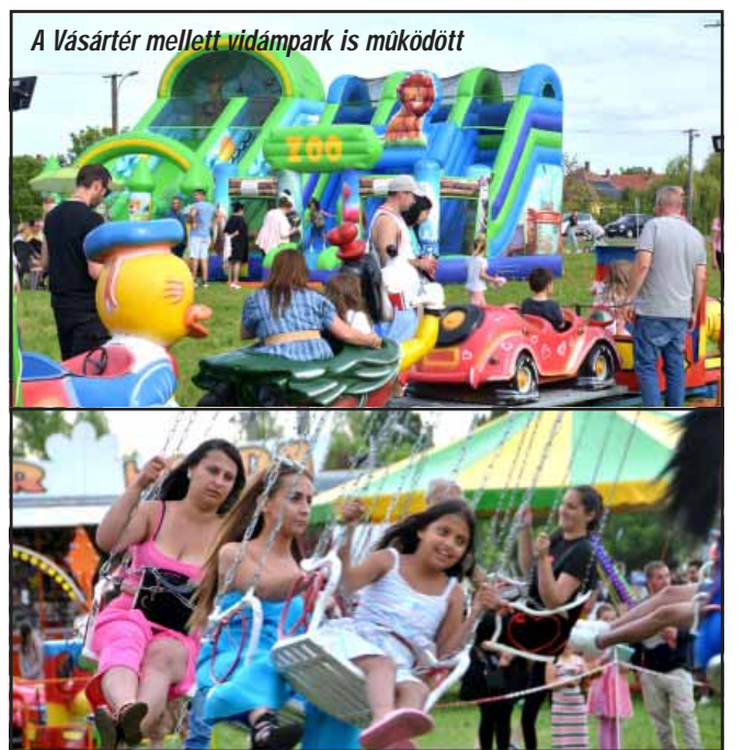
A Vásártér mellett vidámpark is működött