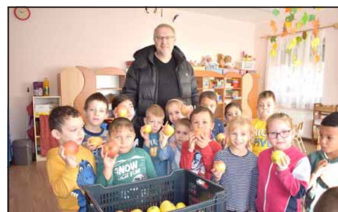
Idén is jutott a legkisebbeknek a friss gyümölcsből

A 2024-ben elnyert, több mint 226 millió forintos közfoglalkoztatási pályázati forrás sikeres felhasználásával nemcsak munkabérezetére nyílt lehetőség, hanem tovább folyt az eszközfelújítás is.