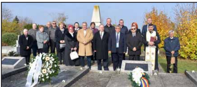
Mindenszentek napja alkalmából Sarkadra látogatott a román főkonzul