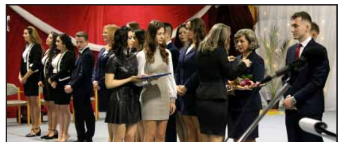
Szalagavató ünnepség a középiskolában