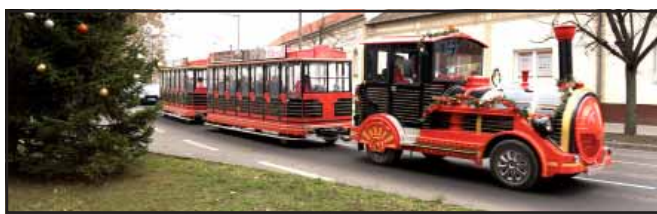
A gyermekek legnagyobb öröme újra közlekedett december 5-én a Sarkadi Mikulásvonat, amely reggeltől sötétedésig röpta a köröket a városban a bölcsődés, óvodás és az általános iskola alsó tagozatára járó sarkadi gyermekkel