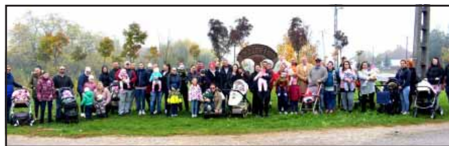
Újabb fákkal gazdagodott az Újszülöttek Ligete