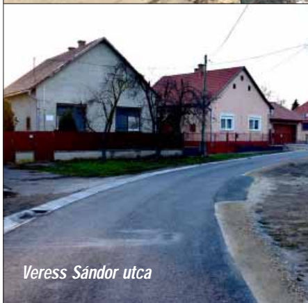
Veress Sándor utca