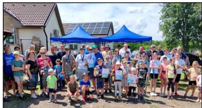
Gyermeknap horgászverseny a Sarkadi Éden HE szervezésében