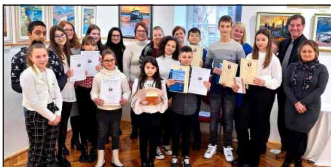
A „Szép Magyar Beszéd” verseny résztvevői