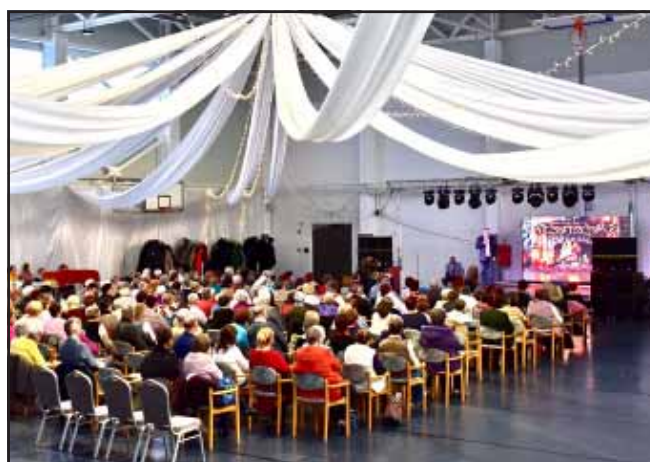
Az önkormányzat és a Kistérségi Humán Szolgáltató Központ újra megrendezte az Idősek Karácsonyát