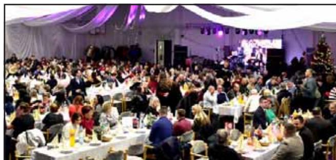
Az ünnepek alkalmából köszöntöttük a jelenlegi és korábbi önkormányzati fenntartású intézmények dolgozóit