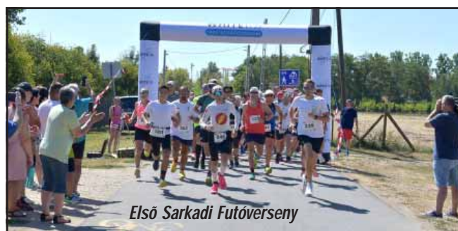
Első Sarkadi Futóverseny