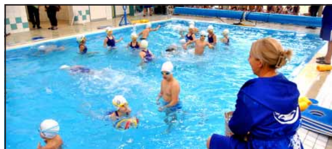
Nyílt nap a Sarkadi Tanuszodában