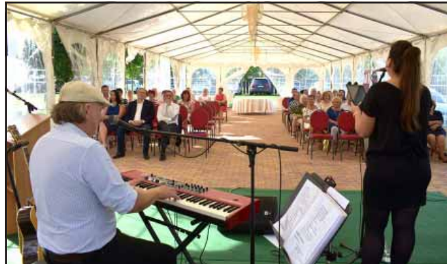
Semmelweis Nap alkalmából az aktív és nyugalmazott egészségügyi dolgozókat köszöntöttük