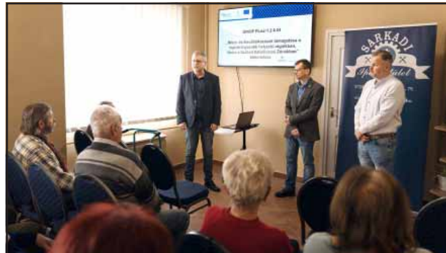
A Sarkadi Ipartestület rendezvénye