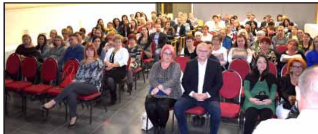
Köszöntés a Szociális Munka Napja alkalmából