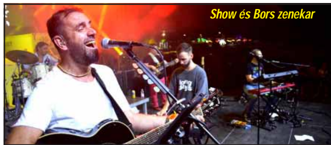
Show és Bors zenekar