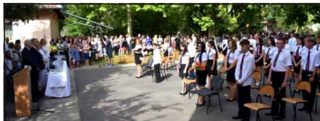
Büszkék vagyunk „Talentum” díjasainkra