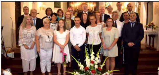
A hagyományokhoz igazodva átadásra kerültek a városi kitétetések. A képen a 2024-es esztendő kitétetettjei