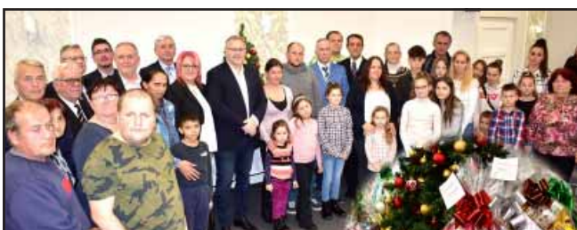
A képviselő-testület tagjai a decemberi ülés keretében saját jövedelmükből ajándékoztak meg egy-egy nehéz sorsú családot