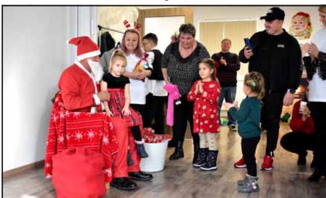
„Csofák ünnepe” a Sarkadi Románságért Team szervezésében