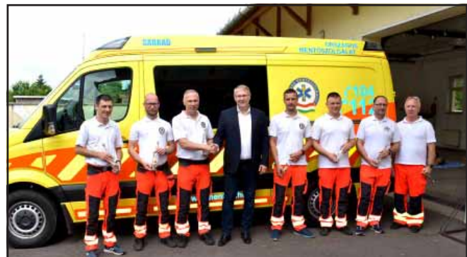
A Mentők Napja alkalmából idén is köszönetet mondtunk a mentő-dolgozóknak