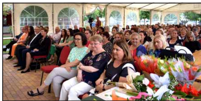
Pedagógusok köszöntése az Éden Camp-ben