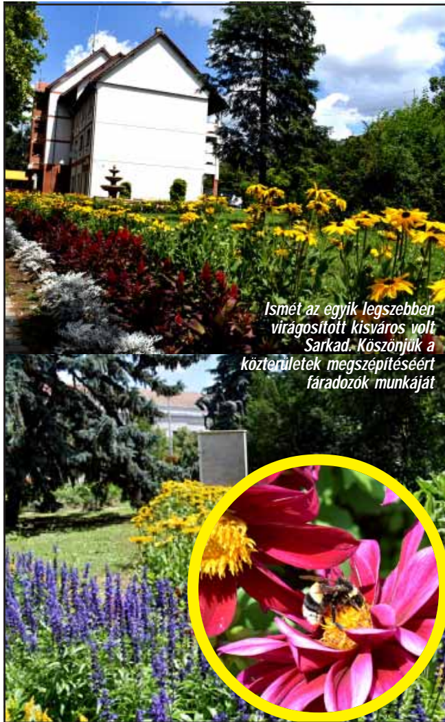
Ismét az egyik legszebben virágosított kisváros volt Sarkad. Köszönjük a közterületek megszépítéséért fáradozók munkáját