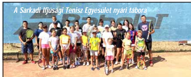
A Sarkadi Ifjúsági Tenisz Egyesület nyári tábora