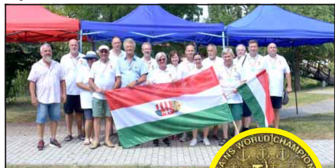
Hajómodellező Világbajnokságnak adták otthont az Eden-tavak