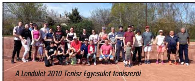
A Lendület 2010 Tenisz Egyesület teniszesei