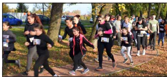
Halloween futás a Táncsics téri sportparkban