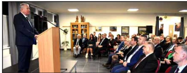
Újévi Önkormányzati Partnertalálkozó