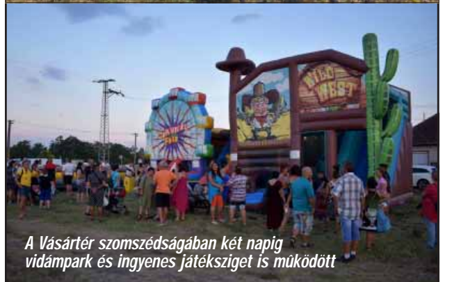
A Vásártér szomszédságában két napig vidámpark és ingyenes játszósziget is működött