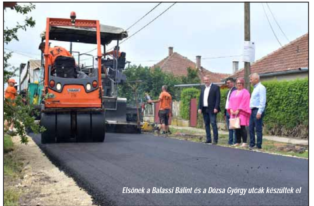
Elsőnek a Balassi Bálint és a Dózsa György utcák készültek el