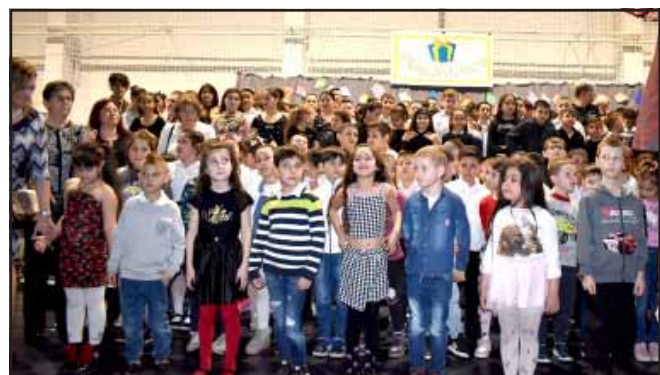
„Ékszerdoboz” című műsoros est a Kossuth utcai iskolában