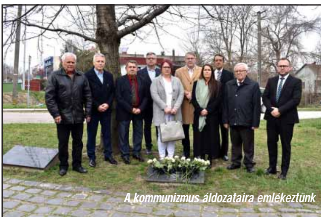
A kommunizmus áldozataira emlékeztünk