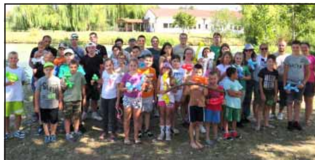
A Sarkadi Horgász Egyesület nyári táborában