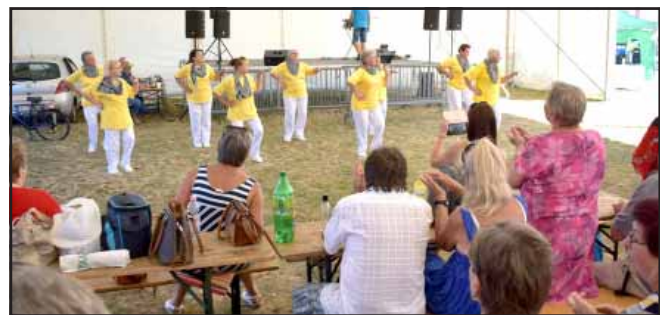
A XII. Kálvin téri Családi Napon gasztronómiai, sport és zenés programokkal is várták az érdeklődőket