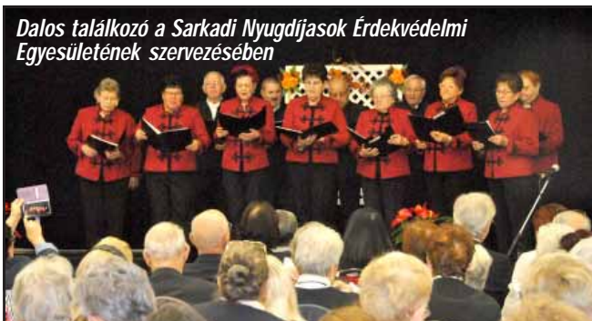
Dalos találkozó a Sarkadi Nyugdíjasok Érdekvédelmi Egyesületének szervezésében