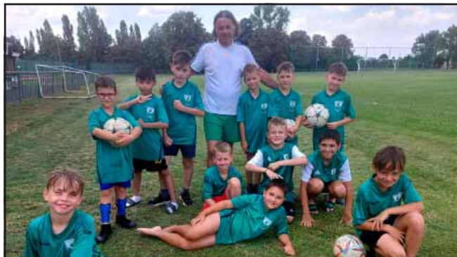
A Sarkadi Kinizsi LE fiatal labdarúgóinak focitáborra