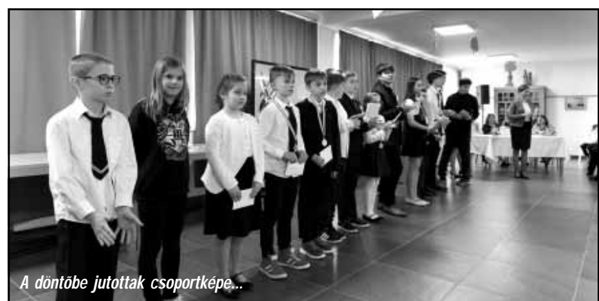
A döntőbe jutottak csoportképe...