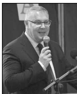
A ballagókat köszöntötte dr. Mokán István, városunk polgármestere is

A szépen feldíszített iskola falai között 22 végzős diák indult el a számunkra utolsó csengőszó felhangzása után. Énekszóval, vidáman és egyben szomorúan járták végig a tantermeket, hogy elköszönjenek a megannyi édes és bús emléket rejtő termektől. A ballagás a tornacsarnokban folytatódott, ahol szép számmal gyűltek össze a ballagóktól búcsúzó családtagok és barátok.