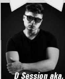
D Session aka. Dandee