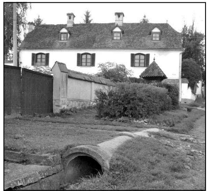
A múzeum felújított épülete és a szekelykapus bejárata