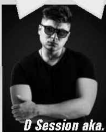
D Session aka. Dandee