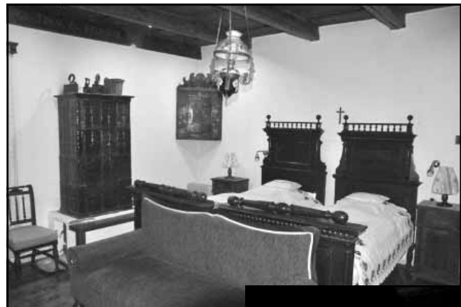
Az udvar (kerekes kúttal) és a hálószoba, melynek kettős ajtaja az udvarra nyílik