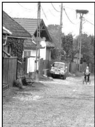
Földút a reggeli páras fák alatt