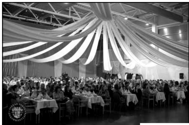
Intézmények karácsonyi estje