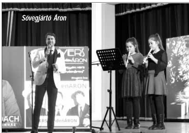
Az Idősek Karácsonyának kulturális műsora

A sarkadi városvezetés évtizedek óta törekszik arra, hogy az ünnepek közeledtével felkeressen minden önkormányzati és oktatási intézményt, köszöntse és megvendégelje az ott dolgozókat, valamint beszámoljon a város, az önkormányzat működéséről, jövőbeni terveiről és persze az aktuális kihívásokról is. Kihasnálva a Sarkadi Általános Iskola Kossuth utcai székhelyintézménye új sportcsarnokának adottságait, idén sem egyenként látogatták végig az intézményeket, hanem egy nagy rendezvényre invitáltak minden sarkadi önkormányzati és oktatási intézményben tevékenykedő dolgozót, valamint