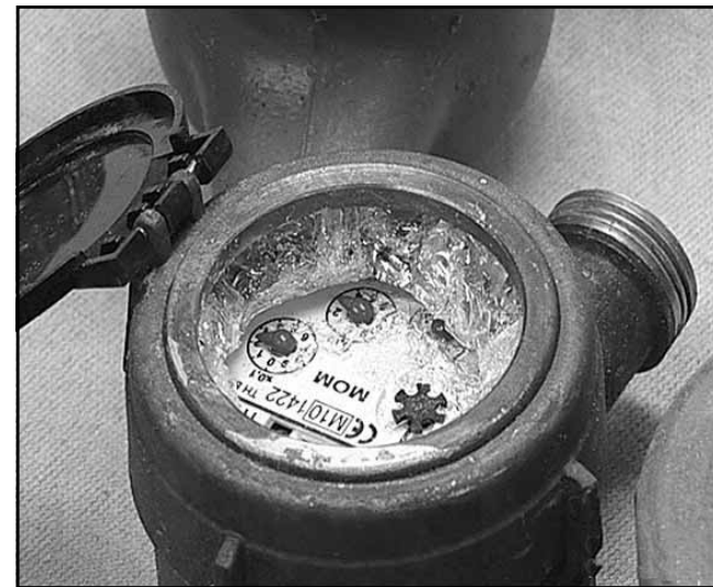
Szétfagyott fogyasztásmérő óra cseréje költséges tétel

A télen is lakott ingatlanoknál fontos, hogy a vízmérőakna szigetelése megtörténjen. Ugyanakkor azokra a vezetékcszakaszokra is kiemelt figyelemmel kell lenni, amelyek kevésbé védett helyen (pincében, falon kívül) vannak, ezeket is célszerű szigetelőanyaggal védeni. A kerti csapokat vízteleníteni kell, valamint a telepített öntözőberendezésekre is érdemes jobban odafigyelni, mert ezek bár fagyállóak, az élettartamukat meghosszabbíthatja, ha víztelenítve vannak.