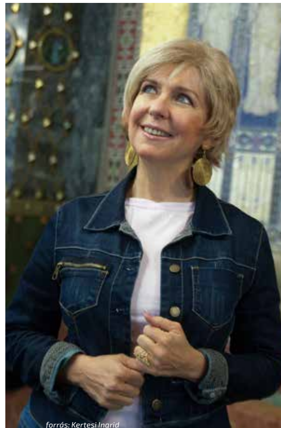
forrás: Kertesi Ingrid