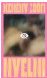
Kemény Zsófi: Nyelni Open Books, Megjelenés: 2024. Szeptember 18.