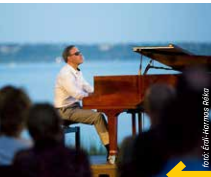
forrás: Érdi-Harmos Réka

Idén is ingyenes koncertek várják a vízparton pihenő zenebarátokat július 16. és augusztus 2. között, három héten át. Tíz Balaton környéki településen, valamint a tatai Öreg-tó partján szórakoztatják és varázsolják el a közönséget a Klassz a pARTon! rendezvényei. Az Érdi Tamás zongoraművész kezdeményezésére megvalósult sorozat keretében az elmúlt évtizedben több mint négyszáz programot valósítottak meg a klasszikus zene nagyjaival, mellettük pedig fiatal tehetségekkel és gyermekprogramokkal örvendeztetik meg minden évben a nyár közepén már kultúrára éhes nyaralókat.