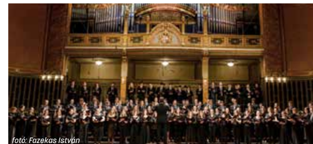
forrás: Fazekas István