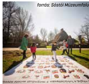
forrás: Sóstói Múzeumfalva