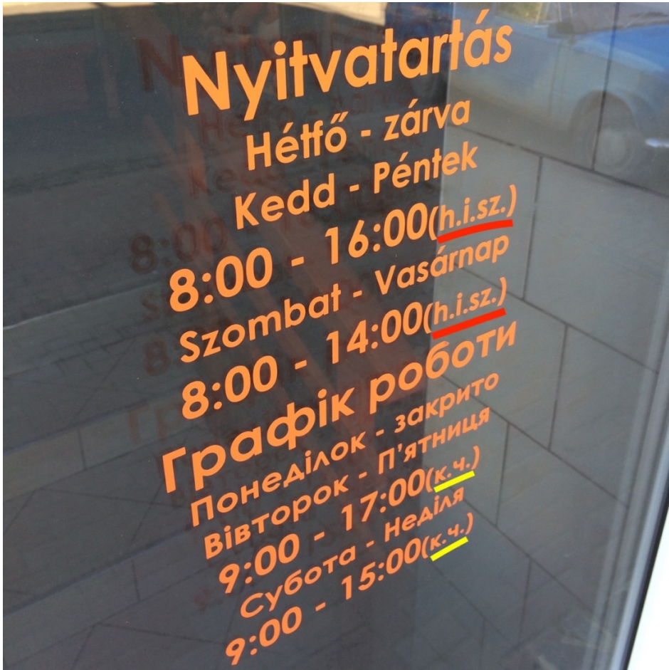
Фото 3. Двухязычный (украинско-венгерский) график работы с уточнением часового пояса UTC+1 для венгерского варианта (“h.i.sz.”) и UTC+2 для украинского («к.ч.»)

Есть также исключения, где в двухязычных вывесках венгерский вариант расписания указывает на киевское время (UTC+2), равно как и его украинский аналог (такое было на фото 2 – «к.ч.» и “kijev idő szerint”). В подобных случаях уточнения просто необходимы, иначе может получиться самая настоящая путаница. К примеру, на фото 4 время для украинской и венгерской версии идентичное, а уточнений никаких нет, поэтому здесь нельзя сказать наверняка, какой именно часовой пояс был взят автором за основу – киевский (UTC+2) или «местный» (UTC+1).