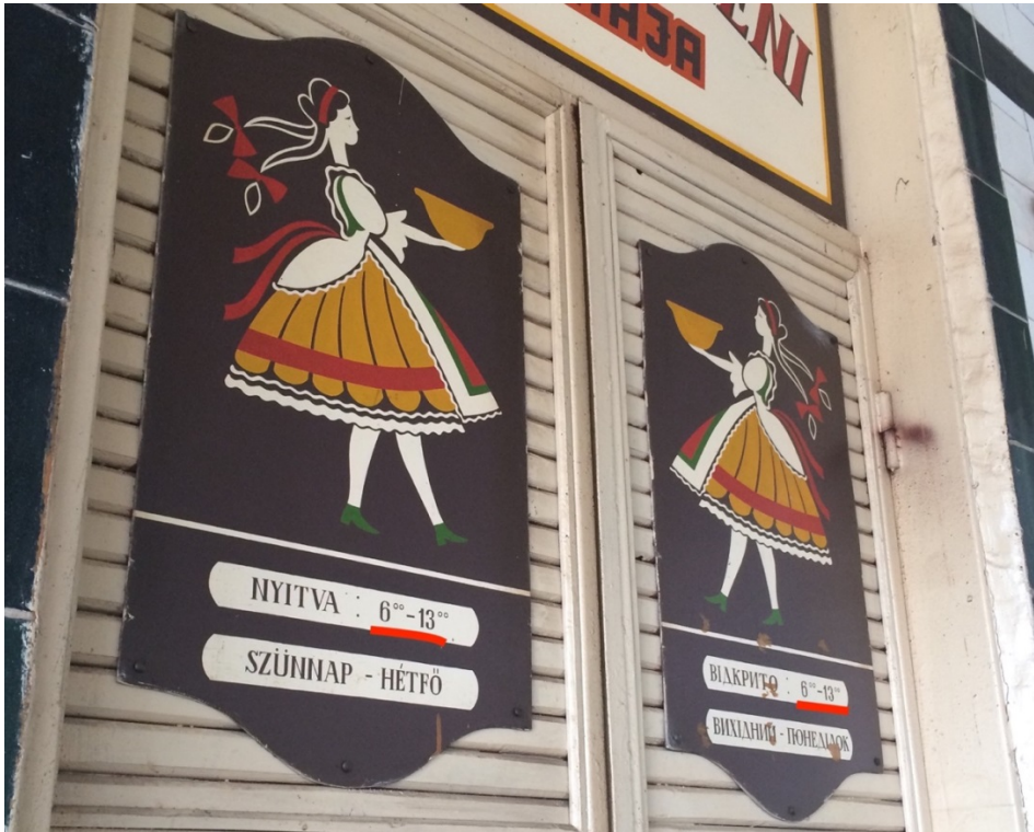
Фото 4. Двухязычный (украинско-венгерский) график работы с одинаковым временем без уточнений

Очень похоже на то, что закарпатские венгры просто знают наизусть, когда работает, например, тот или иной магазин в их населенном пункте в силу того, что даже город Берегово на самом деле не такой уж и большой. Что касается приезжих, то тут, конечно, не помешает лишний раз уточнить время, поскольку универсальной теории его определения на уличных надписях, по всей видимости, не существует. Сколько людей, столько и мнений. Однако, следует еще раз подчеркнуть, что такое «временное разнообразие» характерно только для тех частей Закарпатской области, где проживает доминирующий процент венгероязычного населения. Во всех остальных районах Закарпатья (включая самые большие города – Ужгород и Мукачево) многие люди также знакомы с «альтернативным» временем (UTC+1), но крайне редко используют его на уличных вывесках. Надписи на венгерском здесь тоже редкость.