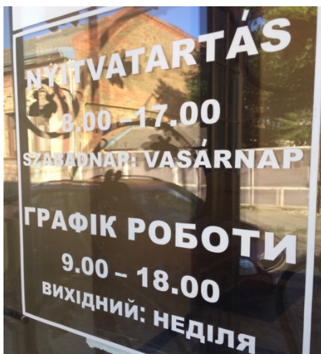
Фото 1. Пример двуязычной (украинско-венгерской) надписи с двумя разными графиками работы – UTC+1 для венгерской версии и UTC+2 для украинской

Как известно, официальным временем по всей Украине является киевское (т.е. восточноевропейское, UTC+2). Однако, в Закарпатской области также неофициально может использоваться центральноевропейский часовой пояс (UTC+1), из-за чего у местных людей формируется некое «двойное» понятие времени (фото 1).