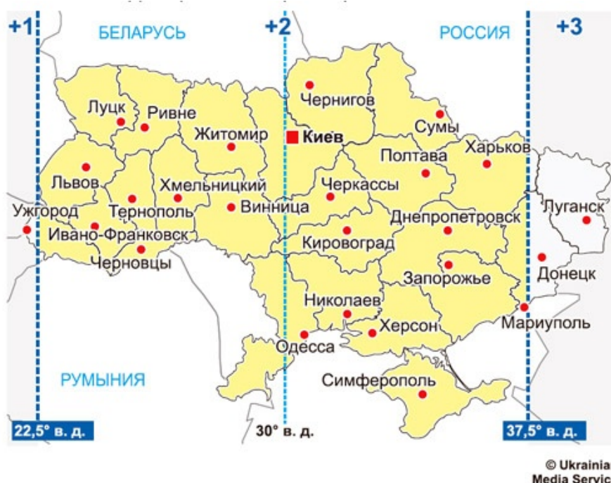
Рис. 1. Расположение территории Украины относительно часовых поясов (ГАЦЕНКО, КУЧЕРЕНКО 2011: URL)

Исходя из предыдущего абзаца, получается, что к летнему времени просто добавляется буква “S” (от англ. “summer” – «лето»), в связи с чем напрашивается вывод, что оно не является базовым. Зимнее время, как правило, считается ближайшим к астрономическому (или биологическому), что можно проследить на примере современной Украины, большая часть которой расположена в часовом поясе UTC+2 (рис. 1).