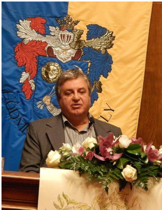
A szerző a könyv bemutatóján, Hódmezővásárhely, 2016. okt. 28.

A könyvet nagyon kis példányszámban nyomtattuk ki, így csak a családtagok és a kutatást, ill. a kiadást segítőket jutottak hozzá. Az elektronikus verzió azonban megtekinthető és szabadon letölthető az Országos Széchényi Könyvtár Magyar Elektronikus Könyvtárából: http://mek.oszk.hu/16200/16246