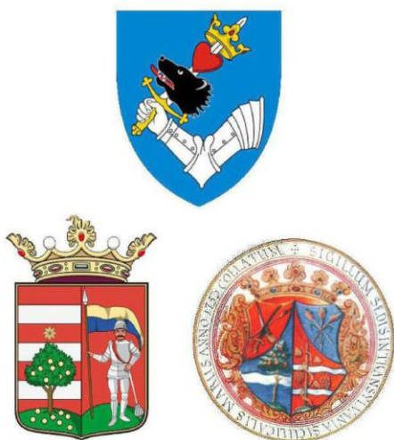
Régi székely címer Marosszék címere és pecsétje