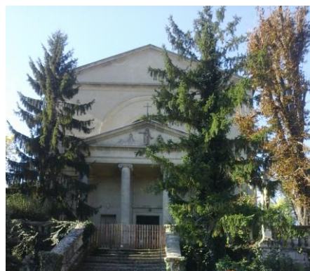
A váli katolikus templom napjainkban