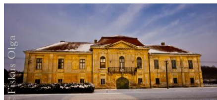
Az Ürményi-kastély