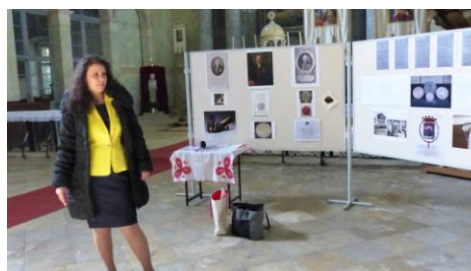
A cikk szerzője a kiállítás tablói előtt