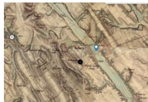
Vál, a második katonai felmérés térképe (1806-1869)