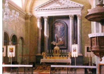
A váli templom belseje

A gótikus templomtoronnyal és történetének kutatásával írásunkban később részletesen foglalkozunk.