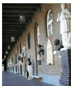
A Nemzeti Emlécsarnok a Dómban - egyelőre az Ürményi-dombormű nélkül

Az Ürményi család kutatása természetesen nem ért véget. Az írásos történelmi anyagokon kívül további tárgyi emlékekre bukkantam. A Szegedi Dóm panteonjának keleti szárnyán 1945-ig Ürményi József országbíró domborműve állott. Az új hatalom azonban a politikai szempontból nemkívánatosnak ítélt személyiségek szobrait eltávolította, és azokat sajnos azóta sem helyezték vissza. Vál Község Önkormányzata és a Váli Faluszépítő és -védő Egyesület kérte Szeged Város Önkormányzatától,