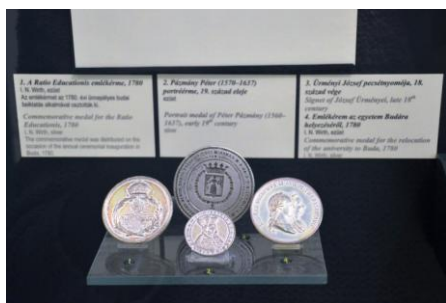
A Nemzeti Múzeum Ürményi-relikviái, köztük a pecsétnyomó

A kiállítást a katolikus templomban rendeztük meg. A kiállított tárgyak között szerepelt