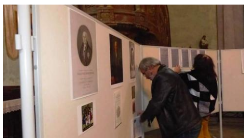
Az utolsó simítások

Sajnos nincs válasz, a rejtély örök titok maradt. Az Ürményi pecsétnyomó állandó kiállítási tárgy a Múzeumban: egy klasszikus pecsétnyomatot a többi képpel együtt a rendelkezésünkre bocsátottak. A Múzeumot a sok segítségért hála és köszönet illeti. Sok érdekességet sikerült összegyűjtenünk az Ürményi családról, amelyek a leszármazottak számára is sok újdonsággal szolgáltak.