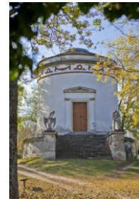
A mauzóleum

Az Ürményi család mauzóleuma, amely a katolikus temetőben található, 1834-ben épült klasszicista stílusban Engel Ferenc tervei alapján. A kör alakú mauzóleum magas, felülvilágított, kupolaszerű épület, felül kápolnával, alul pedig a kriptával. Belső falai empire stílusban készültek, falfestményei a templomot is díszítő hazánkfia, Wagner József alkotása. A falfestmények a halált, az ítéletet, a leláncolt poklot és a boldog örökkévalóságot ábrázolják. A mauzóleum fenntartására Ürményi János pénzt hagyományozott, amely azonban az idők során értékét veszítette, így az építmény számos alkalommal válságos helyzetbe került.