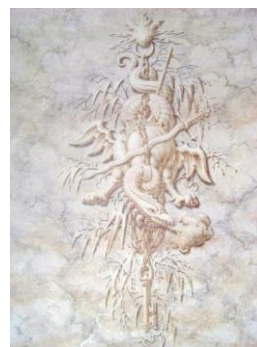
A leláncolt pokol