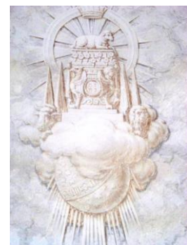
A boldog örökkévalóság