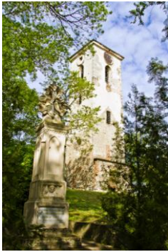
A csonka templomtorony

sokat folytattak, de nem tartották elképzelhetetlennek a felvetéseimet, hiszen a canonica visitatiok 6 is erről tanúskodnak. A legenda tehát mégsem csak legenda, legalább is abban a tekintetben, hogy a kripta létező dolog. De vajon melyik család alussza ott örök álmát?