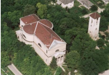
A katolikus templom látképe madártávlatból, mellette a gótikus templomtorony

A váli lányok és asszonyok keze nyomát viseli egymillió téglá, melyeket saját kezükkel készítették a templom építéséhez.