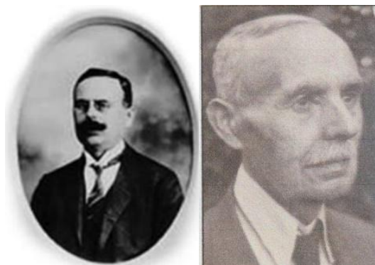
Fazekas Ágoston II. 1933-ban és 1960. k.

1920-ban az Ébredő Magyarok Egyesületének az elnöke. Világi elnöke volt a Központi Katolikus Körnek és tagja volt számos politikai és egyházi testületnek. A Jász Hírlap c. politikai hetilap alapító felelős szerkesztője 1919-1945 között. 1940-ben nyugdíjazásakor Horthy Miklós kormányzó a közélet terén szerzett érdemei elismerésül a magyar királyi kormánytanácsosi címet adományozta neki. Irodalom: Uferné, Sárközi Ágnes: Fazekas Ágoston (II) . Gimnáziumi tanár és főszerkesztő emlékezete. Örökségünk. Jászszági Évkönyv. 2016. (273-281.) Fazekas Ágoston II. apja Fazekas Ágoston I. (* 1858. május 27. -†Kiskunfélegyháza, 1928. december 13. Halotti értesítő . Fazekas Ágoston I. Kiskunfélegyháza diszpolgára, országgyűlési képviselő, tizenkét esztendeig alispán volt.))