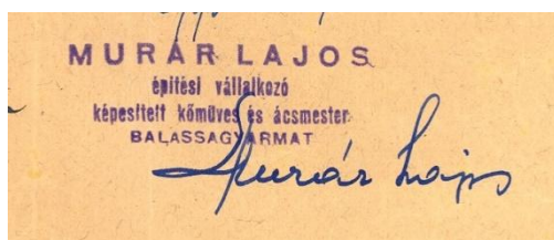
Murár Lajos aláírása 1944. szeptember 25-én egy a Balassagyarmat várossal kötött szerződésen.