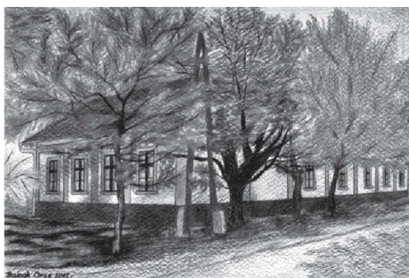
A volt iskola épülete (ma Zombai utca 63. sz.)