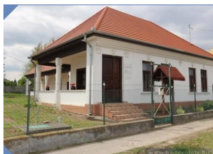
Az ócsai Rédei Károly imaház. 2016.