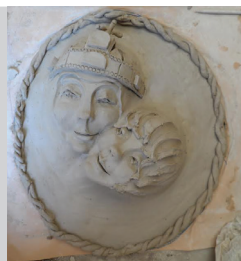
A képen a készülő alkotás egy részlete látható